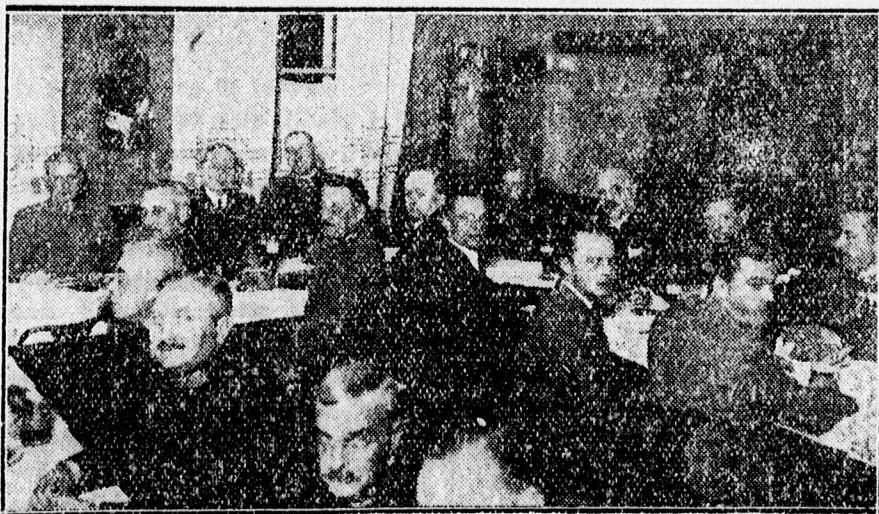
Egy pohár sörre gyűltek össze a meghívottak a bemutató után.

Összesen 350 öltözőszekrényt építettek és 58 kabint alakítottak át a régi gőzfürdő helyiségeiben. A gőzfürdő medencében abban az időben, amikor a nagy medencében uszásoknak megfelelő vizet tartanak, ugyanakkor különböző hőfoku meleg vizet bocsátanak