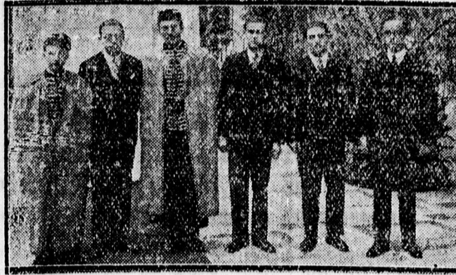
A felavatott új doktorok.