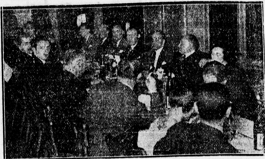
Az IBUSz vezetői vacsorán az Angol Királynőben.