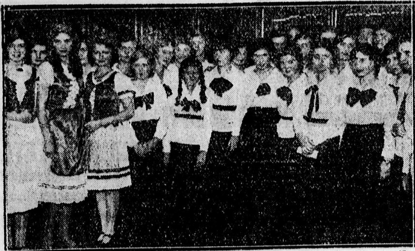
A Svetits liceum énekkara, mely a Szent Erzsébet ünnepeken sikerrel szerepelt.