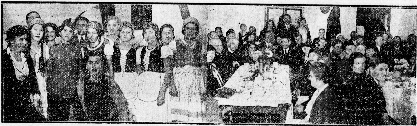
A boldogkerti leánykör műsoros estélyének szereplői és a közönség.

— ESKÜVŐJE ELŐTT tekintse meg a legújabb menyasszonyi képeket Liener műtermének kirakataiban. Csapó utca 1.