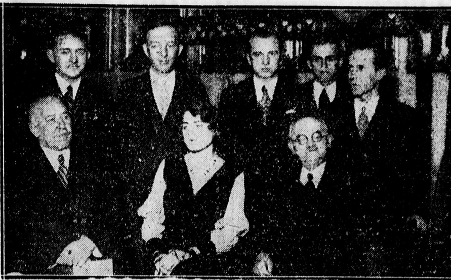
A Csokonai Kör ünnepélyének szereplői.

A szakülést az ifjusági énekhar a Himnusz elnevelésével zárta be,