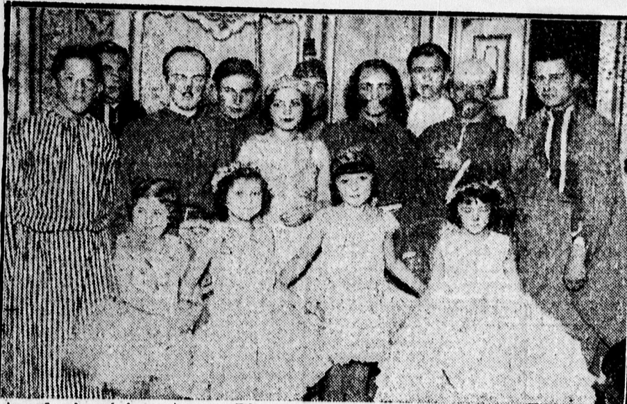
A ref. gimnázium Arany János ü nepélyén a szereplők egy csoportja