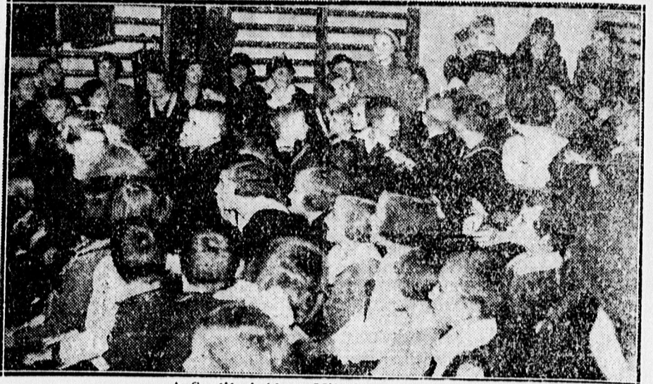
A Svetits intézet Mikulás délutánja.

— Ugyan már mit anzárol itt, nem volt az verés, csak egy kis baráti si-