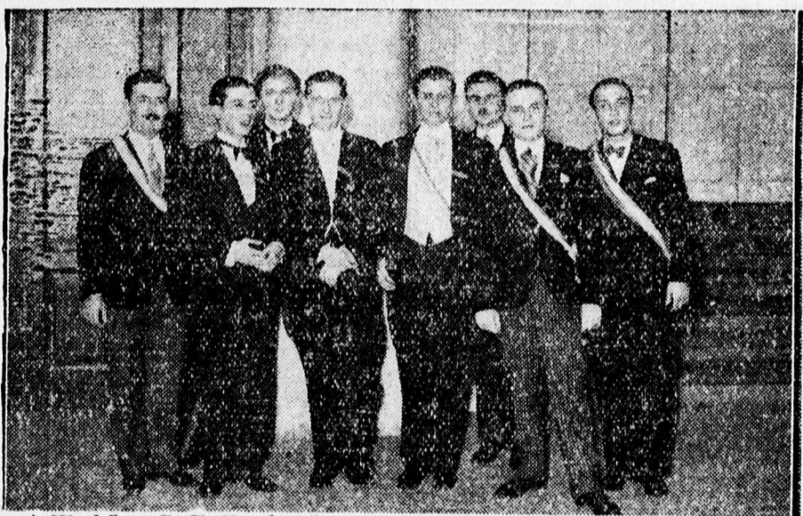
A Werbőczy B. E. Horthy-törzse díszlátározásának rendezősége.

Kedden délelőtt egyébként a kormányzó névnapja alkalmából a debreceni templomokban ünnepi istentisztelet volt, amelyen a polgári és katonai hatóságok testületileg vettek részt.