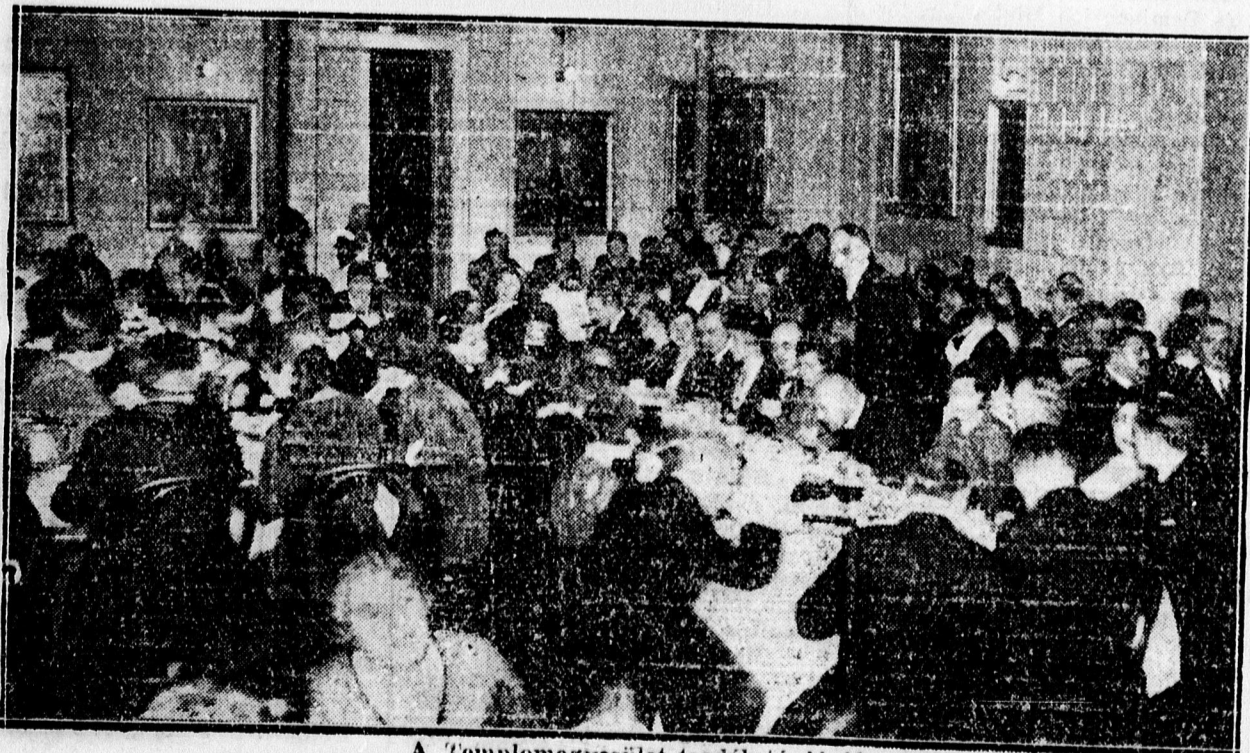
A Templomegyesület teadélutánjáról.