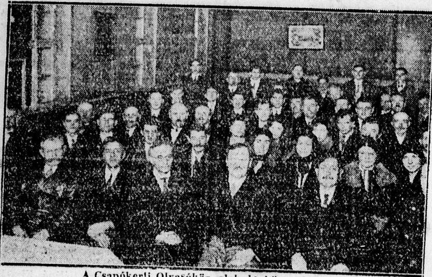
A Csapókeri Olvasókör alakuló közgyűlése.

Érdekes megemlíteni, hogy az új gyülekezeti otthon létrejött egy újabb bizonyossága a hívek áldozatkészségének és a vezetők fáradságtalan ügybuzgal-