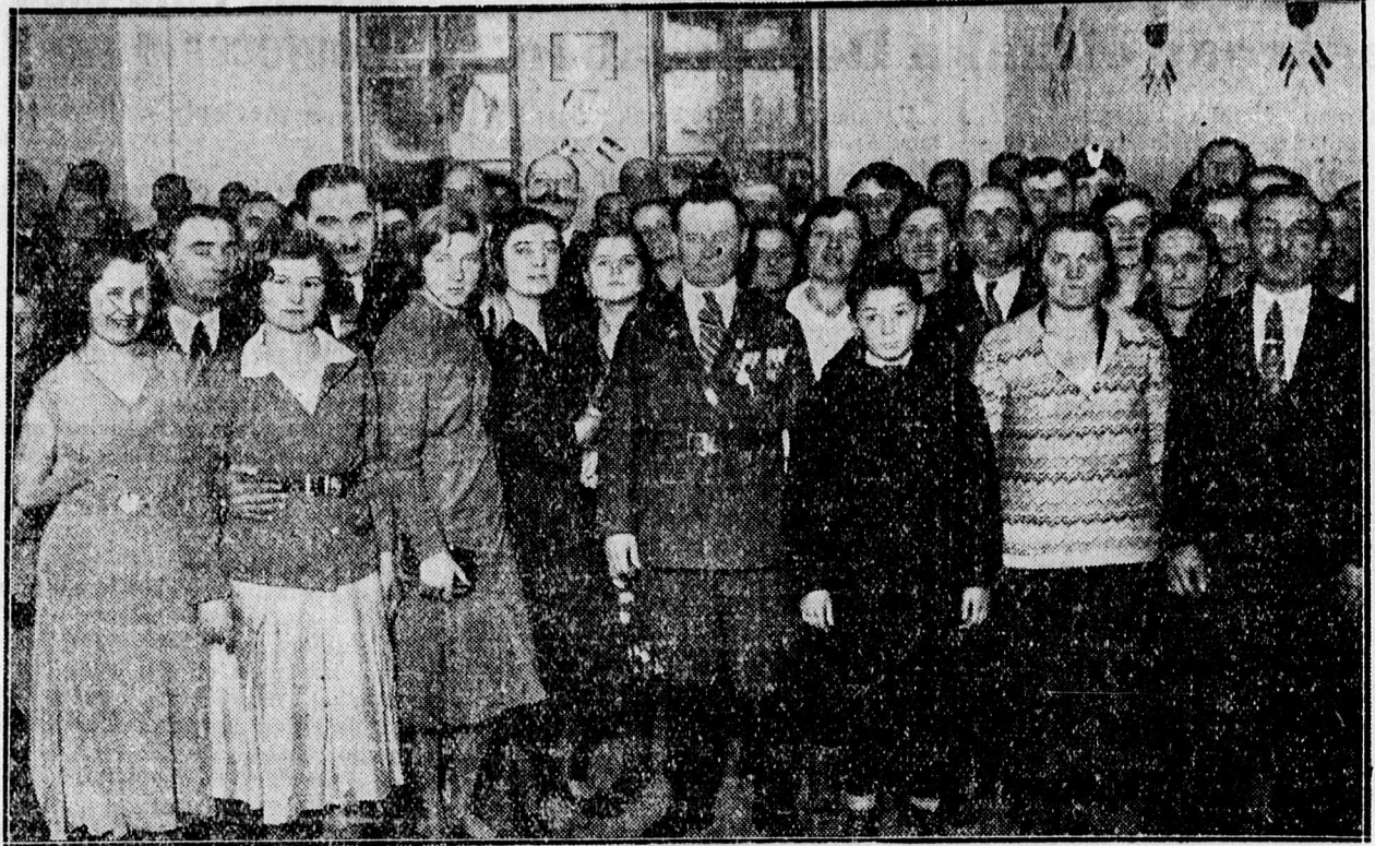
A frontharcosok táncmulatságáról.

— Közgyűlés a Wolaffka-telepen. A Wolaffka-telepi Olvasókör elnöksége hó 15-én, azaz vasárnap délután 4 órai kezdettel évváró közgyűlést tart, melyre az egyesület rendes és pártoló tagjait tisztelettel meghívja az Elnökség. Pontos megjelenést kérünk.