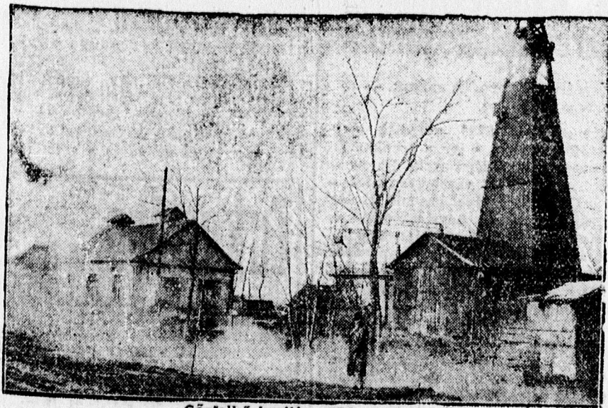
Gőzfelhő borítja a Sámsoni utat.