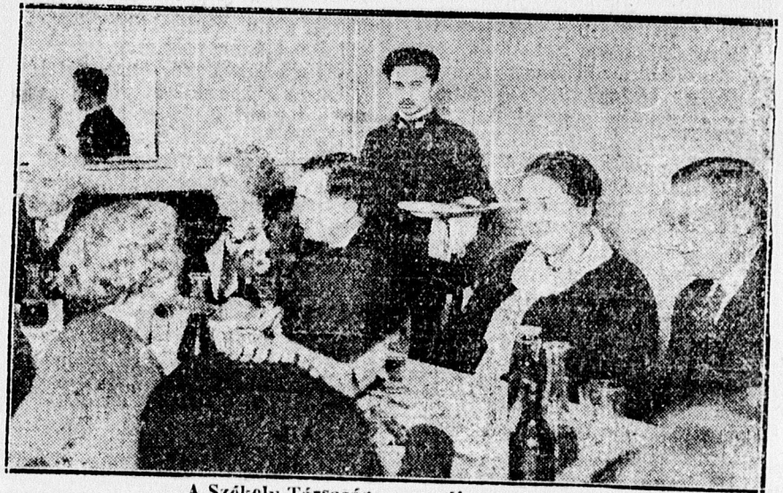
A Székely Társaság vacsorája az Angolban.

A közgyűlést az Angol Királynőben társas vacsora követte.