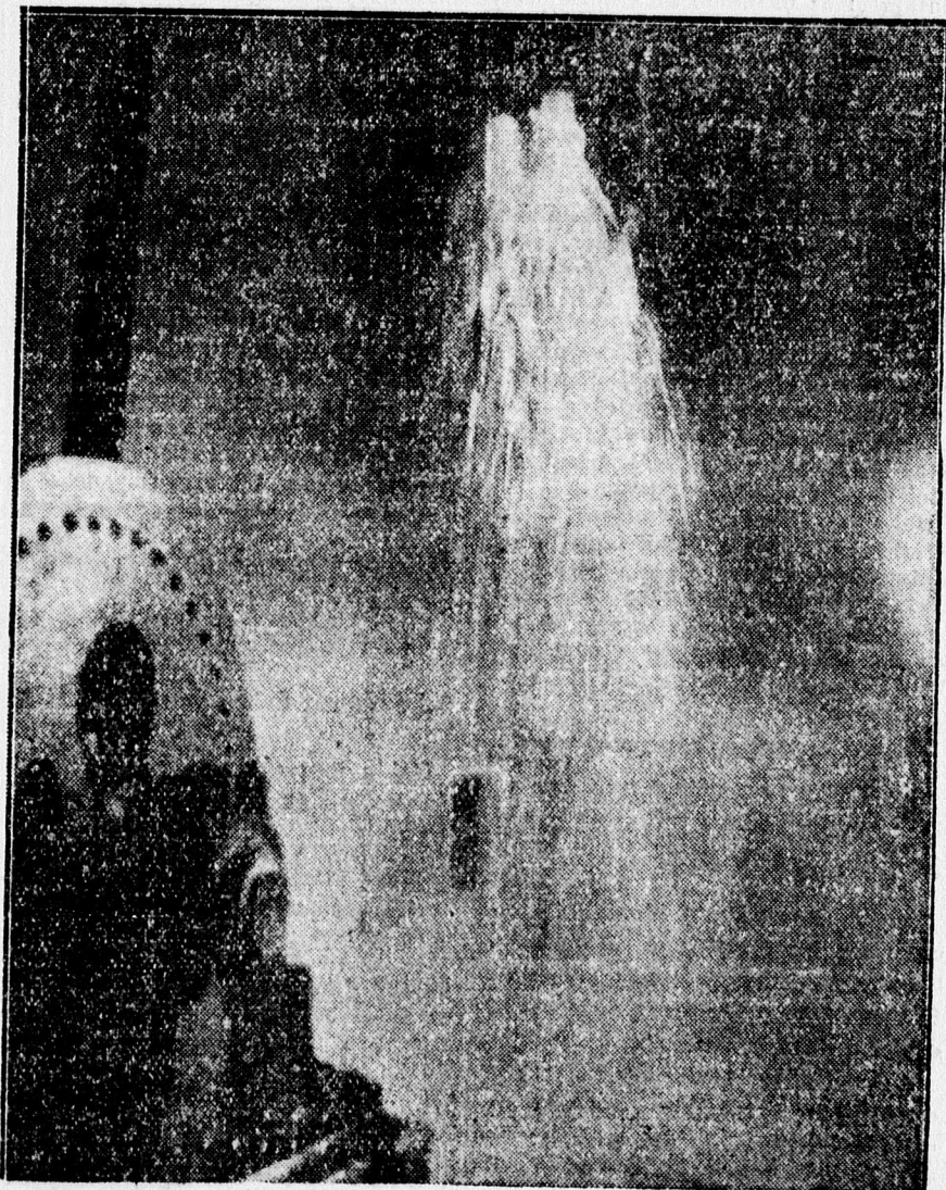
Hatalmas erővel 8 méter magasra szökik a hőforrás vize.