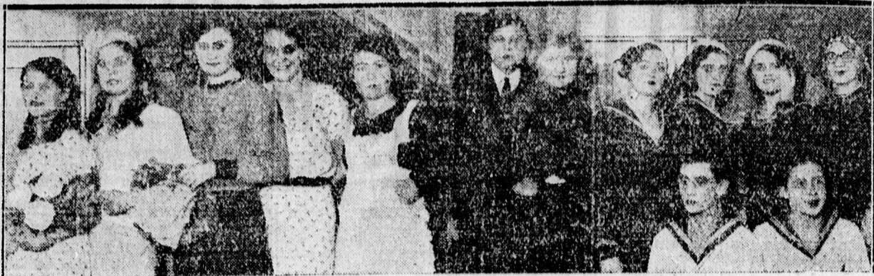
Az »Erzsébet Leánykör« MAV műhelytelepi előadásának szereplői.