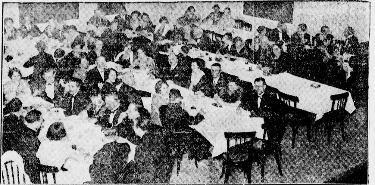
A Szociális Missziótársulat bőlé-estélyéről.

Általában az egész est kellemes benyomást gyakorolt a hallgatóságra s méltán illeti az elismerés a gondos rendezőséget.