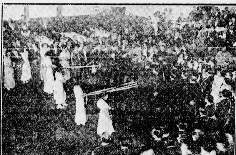
Beyonulás a cotillon tánchoz a Szociális Missziótársulat bőlé-estélyéről.