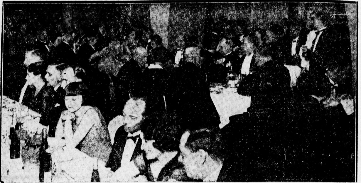
A mérnökök és építészek társasvacsora rajja.

1933. április 16.—24-én Győrött lesz országos fényképképzés, melyen csoportunk 24x30-as fényes-fehér-fekete egységes gyűjteménnyel vesz részt. A győri kiállításra egyesületi helyiségünkbe 1933. április 1-ig adandók be a képek előszűrés, egységes kartonozás, keretezés végett. Második cserkész pályázat feltételeit közelezen közöljük.