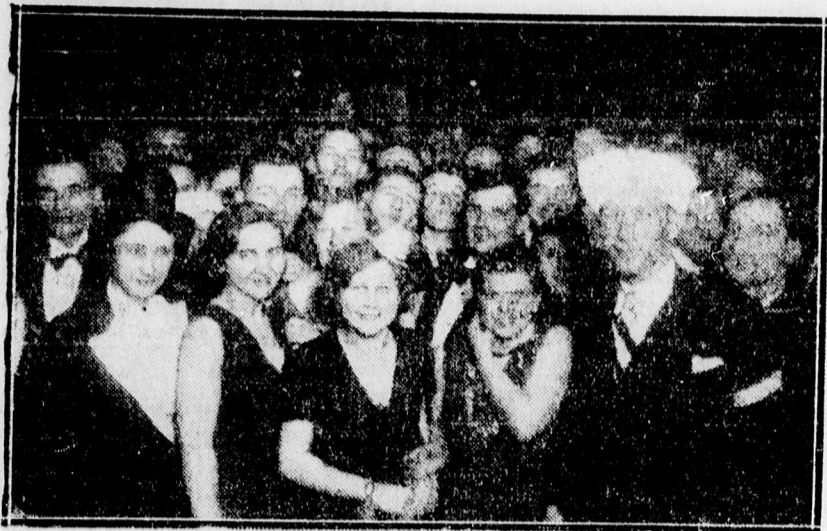
A világítási vállalat egyes ületének álarcos báljáról,