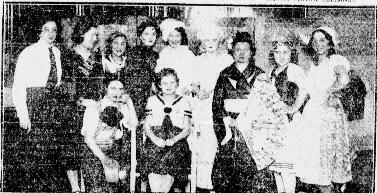
A Svetits nőipariskola előadásának szereplői.