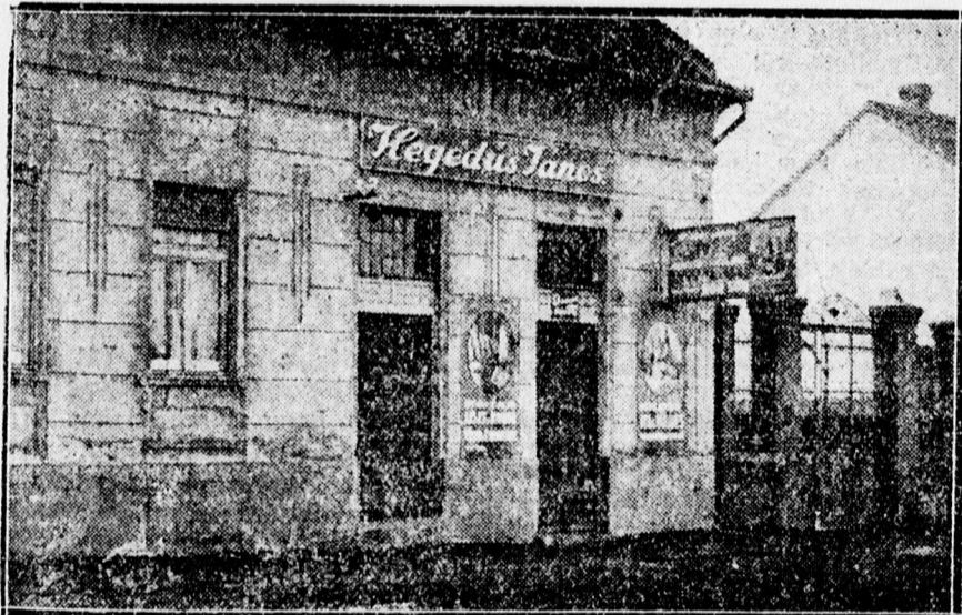
A gyilkosság színhelye: a Hegedűs-ház.

A helyzettel ismerős egyének követték el a gyilkosságot, akik észrevétlen jutot- tak a házba -- A tettesek nem találták meg Hegedűsék elrejtett pénzét, csak kisebb összeget és egy aranyórát vittek el -- Egy gyanúsított a rendőrségen