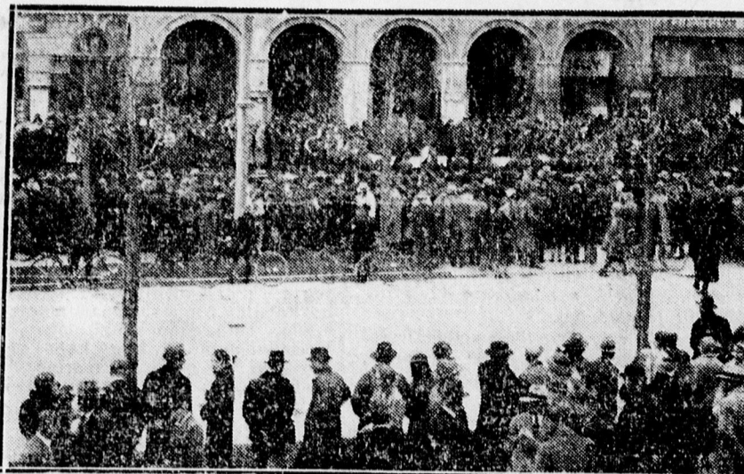
Nagy tömeg hallgatja a vasárnapi térzenét a városháza előtt.