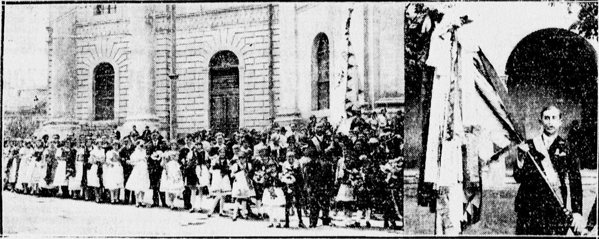
A ref. tanítói vegyeskar zászlószentelési ünnepélyéről. Kivonulás a nagytemplomi istentiszteletről.