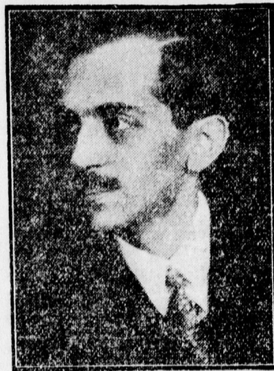
Dr. Nizsalovszky Endre egyetemi ny. r. tanár.

A tudós előadó az érdekkutató jogtudomány módszerének kutatása mellett foglalt állást. A kodifikált kereskedelmi és váltójog körében ez kézenfekvő is, hiszen a kodifikált jogban a törvény által szolgáltni kívánt érdekek világosan kifejezésre jutnak. A jelentős részben a bírói gyakorlat által kiépített általános magánjog területére nézve azonban az előadó bizonyos fokig maga is elismerte a jogi fogalmakból vont következtetés létjogosultságát, mert nem lehet kizártnak tekinteni, hogy a régi irányzat szellemében nevelkedett bíró annak a konkrét esetnek az eldöntésében, amely előbe került, valóban a fogalmi konstrukció útján haladt és így a határozatban megjelenő részlet-