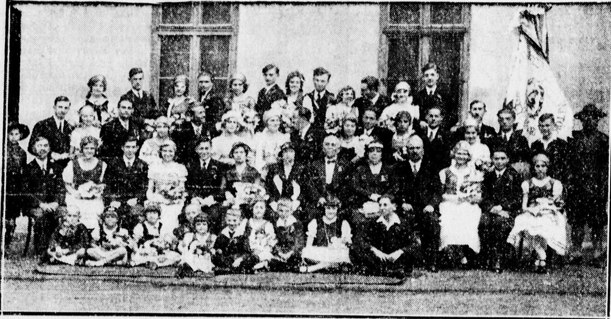
A ref. tanítói vegyeskar.