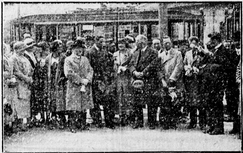
A holland újságírók megérkezése Debrecenbe

Este a Hollandiában járt leányok és szülők, valamint a város és az egyetem képviselői barátságos vacsorára gyűltek össze a Bikában. A zenekar a holland himnuszot játszotta, majd a