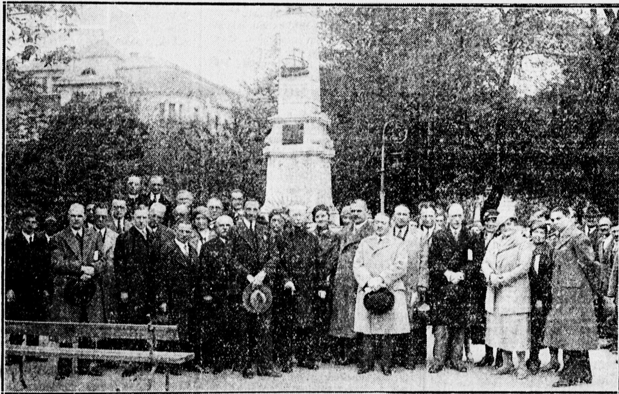
A holland újságírók és debreceni kísérőik a gályarabok emlékoszlopánál

Jelentették, hogy oly körülmények között, szüvelyességgel sehol útközön nem fogadták őket, mint Debrecenben. Minden pontosan, percre elő volt készítve, a debreceni Idegenforgalmi Bizottság méltán lehet büszke erre a dícséretre, mert a vendég újságírók között a holland idegenforgalmi szövetség vezetői is képviselve voltak.