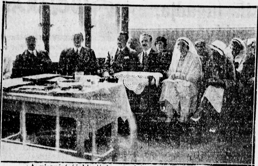
A vizsgáztató bizottság az új testvérek vizsgáján.