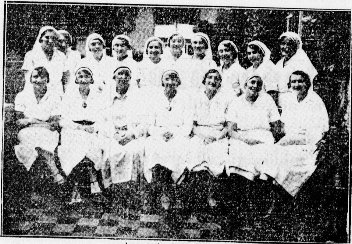
A most vizsgázott új testvérek.