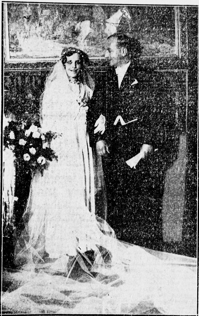
Az ifju pár a szülői otthonban, közvetlenül az esküvő előtt.

minden törekvésükön, minden reményükön, minden vágyatukon. Ha Istennel kezditek, mennyországban végzitek. Az Isten szeretetének eljegyzési gyűrűje ragyogjon a kezeten. Aki közületek buzgóbb, vegye a kezébe a Bibliát és olvasson belőle néhány verset naponként és adjon hálát Istennek, hogy az „egyes” családba helyezte. A pusztulás anyyala nem megy be azon az ajtón, amelynek küszöbét a bentlakók a szeretet szövetségének véreivel hintették meg. A másik tanácsom az, hogy amennyire tőletek telik,