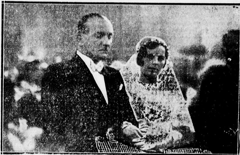
Az ifju pár a nagytemplomi esküvői szertartás alatt.

— Az imádság nem mindenre elég a családi életben. Nem mindig úgy mennek a dolgok, ahogy szeretnénk, egyszer a férjnek, máskor a feleségnek kell engednie. Ismerjétek ki egymás gyengéit, tanuljátok ki egymás érzékenységét és óvakodjatok egymást megbántani. Sohase