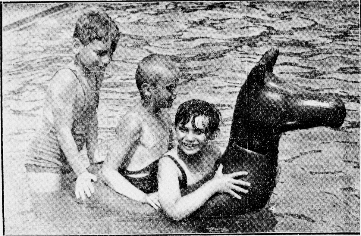
AZ IGAZI GYERMEKÖRÖM A STRANDON.

Nyilvánvaló tehát, hogy a néptürdő, ha jó időjárás van, nem árt a nagyerdei strandnak, amelynek a kánikulai napokon az idén is meglesz a rekordközönsége.