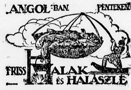
ANGOL-BAN PÉNTEKEN FRISS HALAK ÉS HALÁSZLÉ