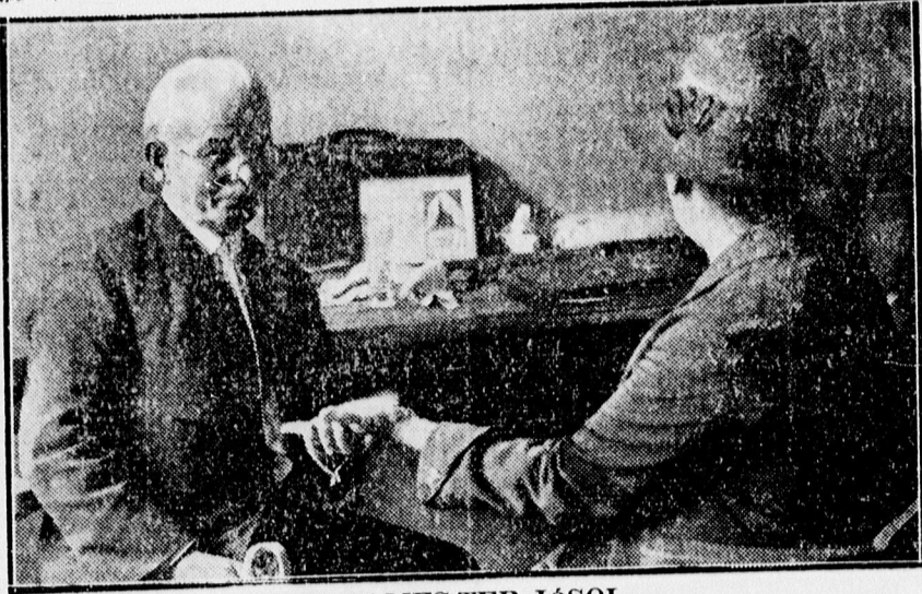
SZIRIUSZ MESTER JÓSOL.