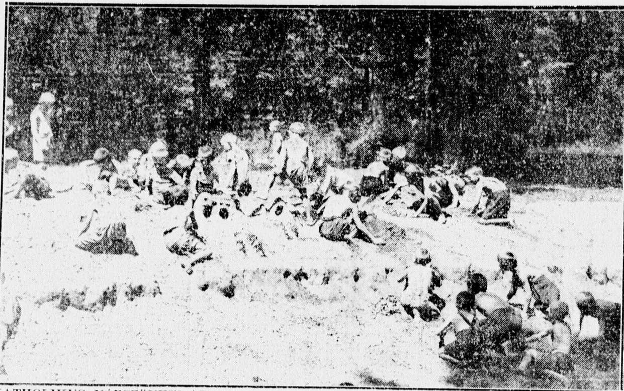
A KATHOLIKUS NEPSZÖVETSÉG NYARALÁSI AKCIÓJÁN A GYERMEKEK HOMOKVÁRAT ÉPÍTENEK.