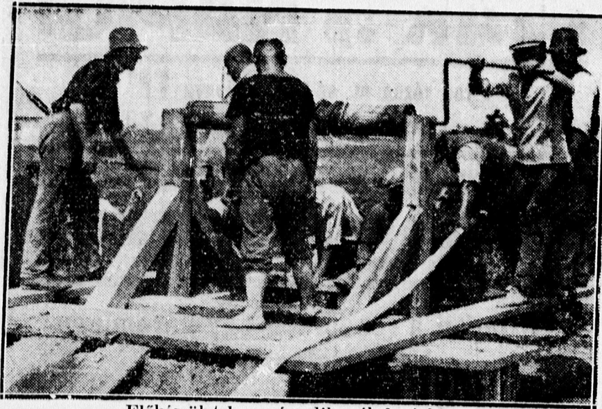
Előkészületek a második mélyfuráshoz. A gőzgépet tápláló kut tisztítása.