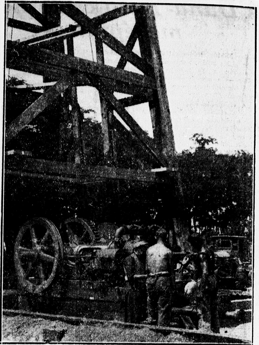
Előkészületek a második mélyfuráshoz. Szerelik a furógépet.