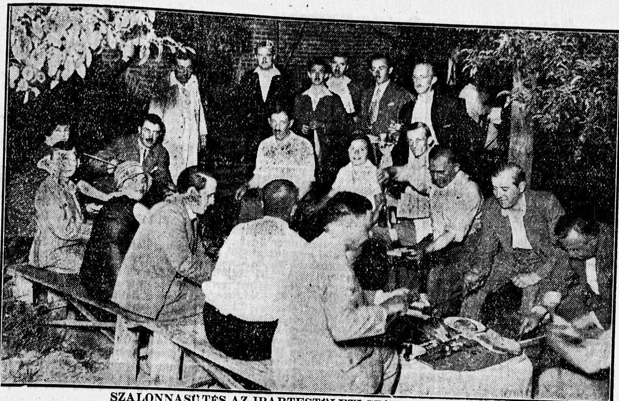
SZALONNASÚTÉS AZ IPARTESTÜLETI SZÉKHÁZ KERTJÉBEN.