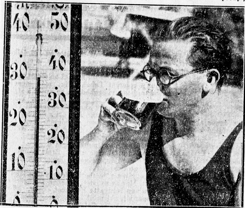
Vasárnap a hőmérő árnyékában.

dot, július 30-án pedig 2636. Ezek a napok hétköznapok voltak, mert a rákövetkező nap, július 31-én 6415 főnyi tömeg vetkőzött fürdődresszbe a Nagyerdőn, tekintve, hogy akkor még nem volt meg a Kassa uti népfürdő. A nagyerdői strand idei látogatottsága tehát körülbelül egy szinten mozog a múlt évvel, a szaporulatot a Kassa uti népfürdő jelenti, ami azt mutatja, hogy az új népfürdő hivatást tölt be és valóságosan néphigiéniai hézagpótló szerepe van Debrecenben. Egész új rétegeket kapcsolt be a napfény-, víz-