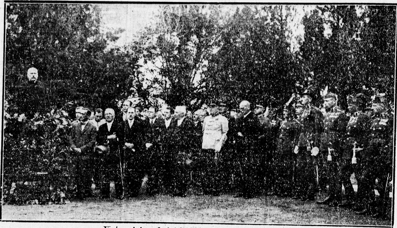
Katonai és polgári küldöttségek az ünnepélyen.