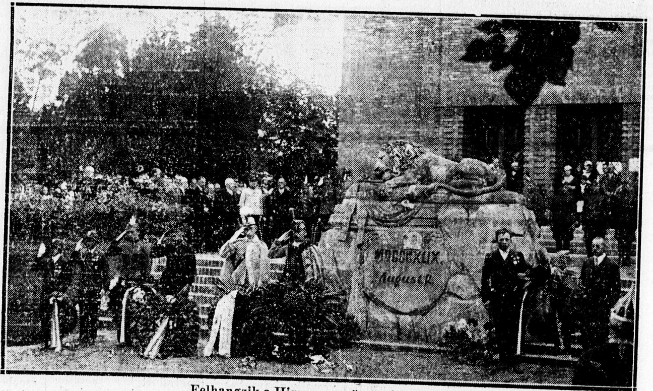
Felhangzik a Himnusz az ünnepélyen.

gyar földön, melyek nem dőlnek le, nem törnek össze, ezek a szívekben vannak felállítva s míg egy magyar szív tud dobogni, addig az emlékek is beszélni tanítanak. 1849 augusztus 2. Csak egy részecske a kétéves szabadságharcból, de van benne annyi erő, hogy e város százezernyi népe dicselkedve emlegeti, voltak honvédeink,