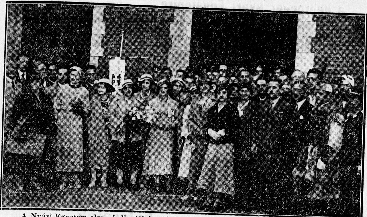
A Nyári Egyetem olasz hallgatói és a fogadásukra megjel entek a debreceni állomáson.