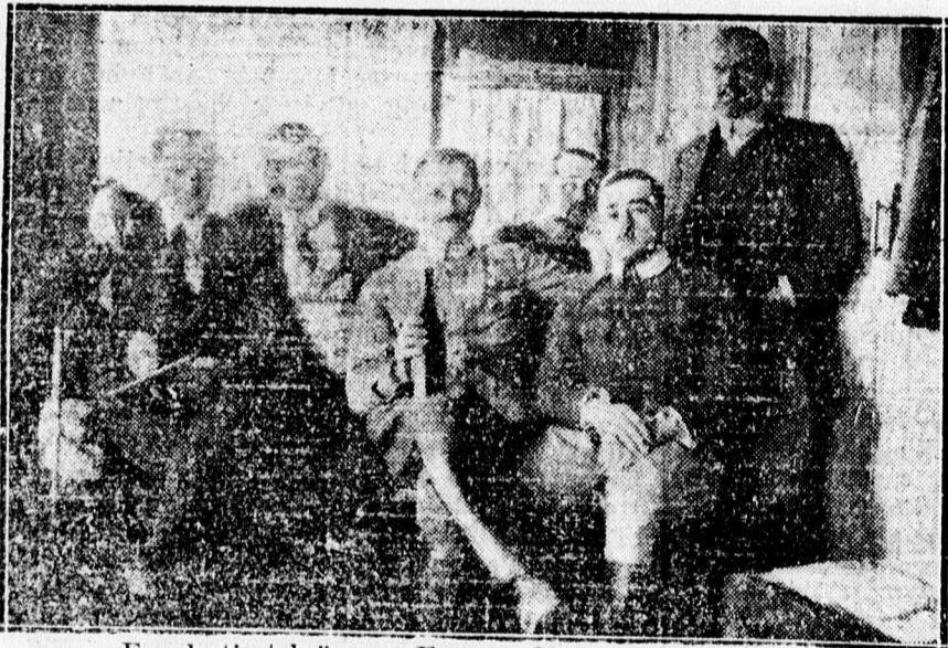
Fogoly tisztek ünnepe Ferenc József születésnapján.

A táviratot némétül megfogalmazta Hajdu hadnagy honvédtiszt és feladták a fogságban is királyhű magyarok a király címére Bécsbe. Csodálatos véletlen, hogy az orosz cenzura, mely akkor még hirhadt volt, ezt a táviratot továbbította. Érdekes véletlen, az bizonyos. Nem igen volt erre példa az egész világháboru idején. A fogságban selymódó ellenséges tisztek hódoló távirattal keresik fel távoli királyukat, legfőbb hadurukat.