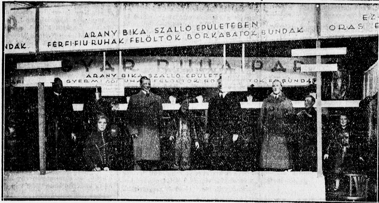
MAGYAR RUHAIPAR SZENZÁCIÓS VASÁRI KIRAKATA.