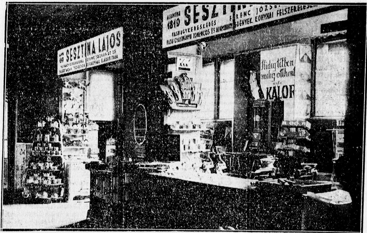
SESZTINA LAJOS CÉG NAGYSZERŰ KIÁLLÍTÁSA AZ ARANY BIKÁBAN.

A kiállítás egyik vonzereje Soltész rádióháza. Csillárjai, kerékpárjai, varrógéppjei hasonlóan nagy népszerűségnek örvendenek.