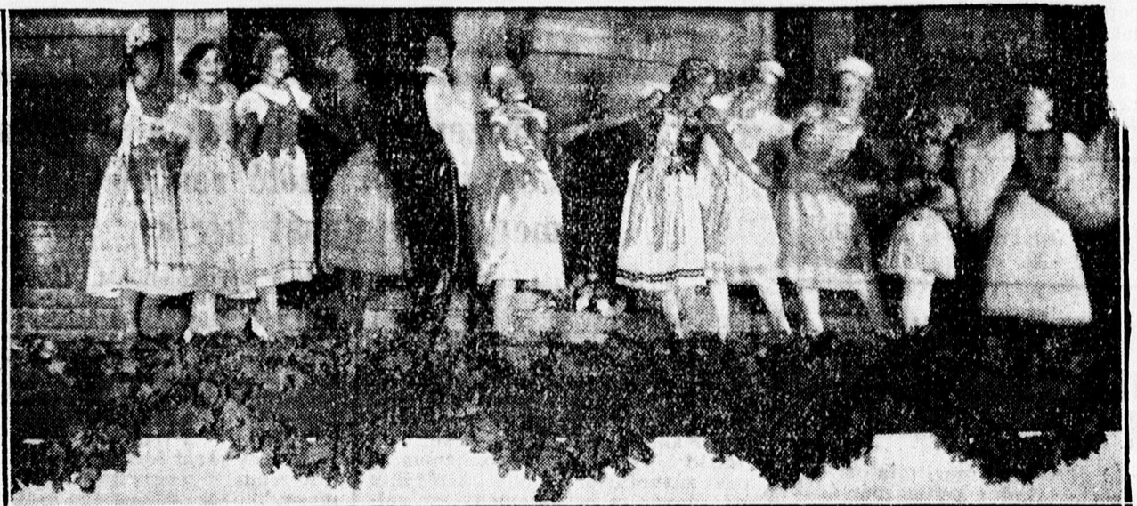
A SZABADTÉRI ELŐADÁSRÓL. Jelenet a Magyar Rapszódia előadásáról.

gek vonultak a Déri térre. Ember ember hátán szorongott és a rendezőségnek, rendezőségnek komoly munkát adott a rend fenntartása.