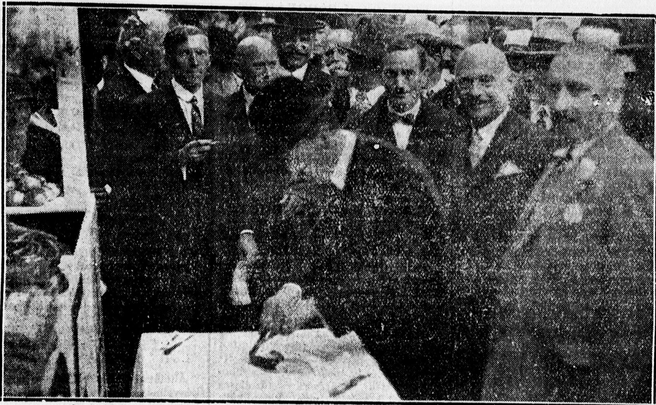
TÓRY ÁLLAMTITKÁR MEGRÓSTOLJA BÓDE HUSIPARI CÉG NAGYSZERŰ KÉSZÍTMÉNYEIT.

A Kollégium gyönyörű sátorvárossá átalakított udvarán a következő értékesebb pavilonokat látjuk: