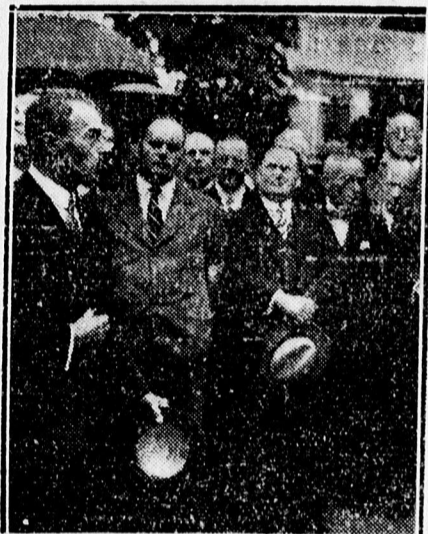
Az államtitkár megnyitja az ipari vásárt.