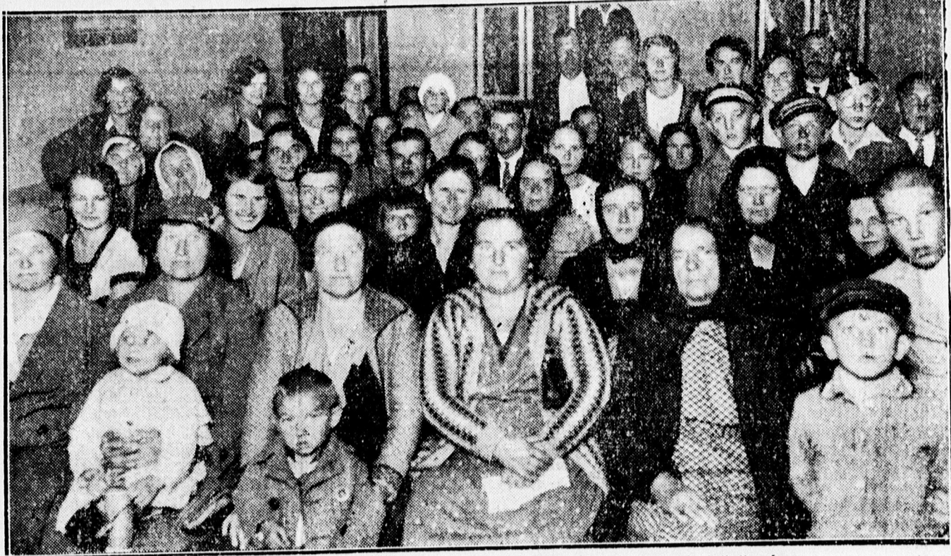
A Wolffkatelepi olvasóköri rendezett műkedvelő előadás közönsége.