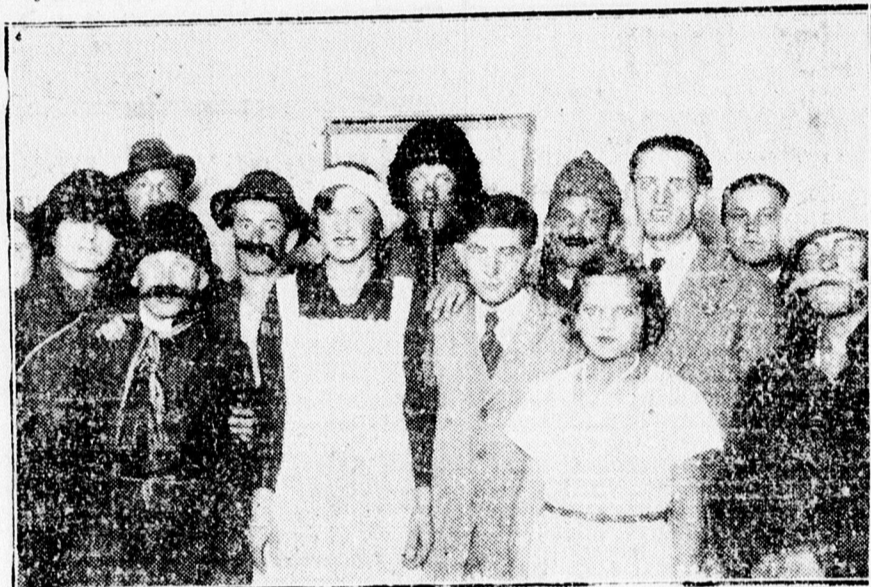
A Wolffkatelepi műkedvelő előadás szereplői.