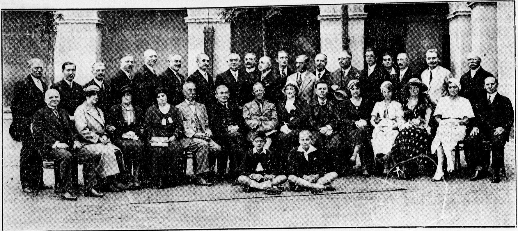
30 éves érettségi találkozó a Kollégiumban.