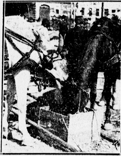
Egy fából eszik a... szénát.