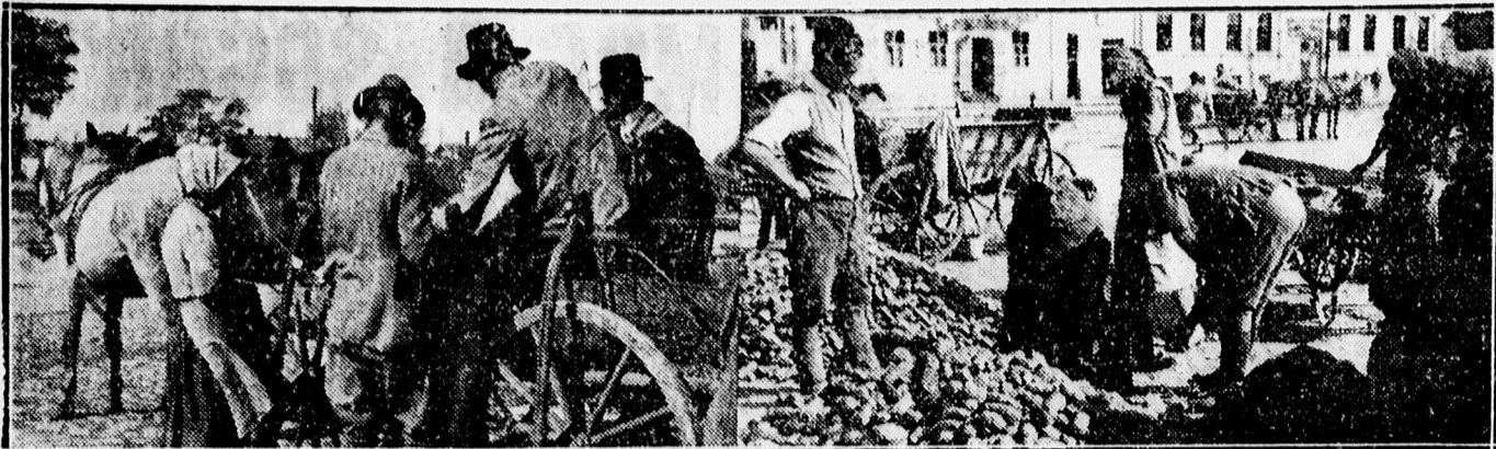
Sikerült a vásár a szemes tengerire.