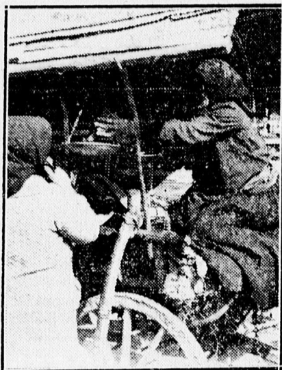
Mérik a borsódi szilvát.