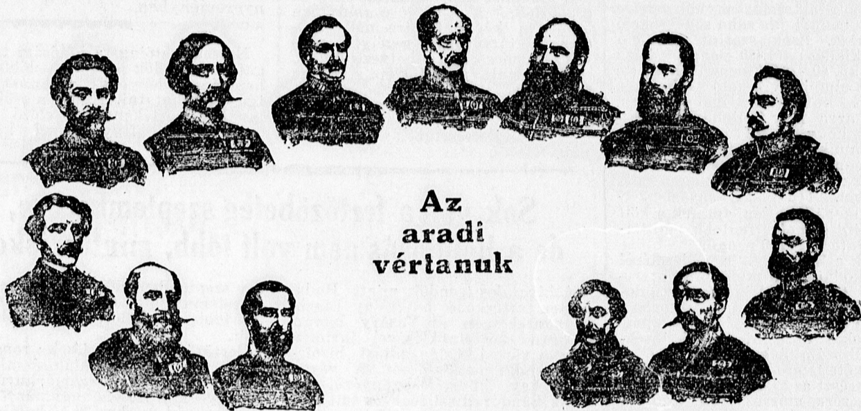
Az aradi vértanúk

Csodálatos végzet a magyar élet. Október 6-án üli meg ezeréves mult-ját és ezen a komor toron készülődik fel arra a haragra, amely megör-zi az idők végezetéig.