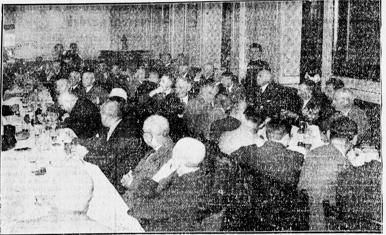
A kollégiumi diákszövetség összejövetele az „Angol Királynő”-ben.

Elismerő levelek tömege igazolja annak kiváló minőségét.