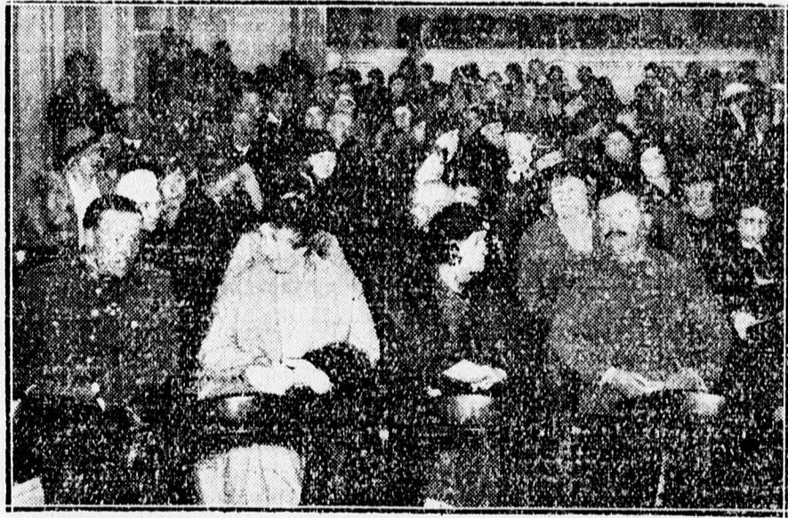
A Szociális Missziótársulat kulturelőadásának közönsége.

azt a nagy történelmi kapcsolatot, mely az ősi Szentföld és a mai ember között minden körülmények között megvan és mindig meg is marad.