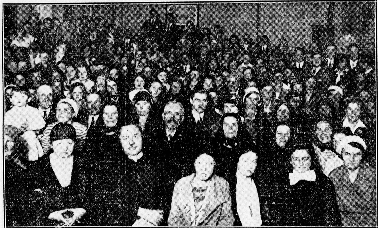
A csapókerti ref. egyházzszi leánykörtagok által rendezett előadás közönsége.