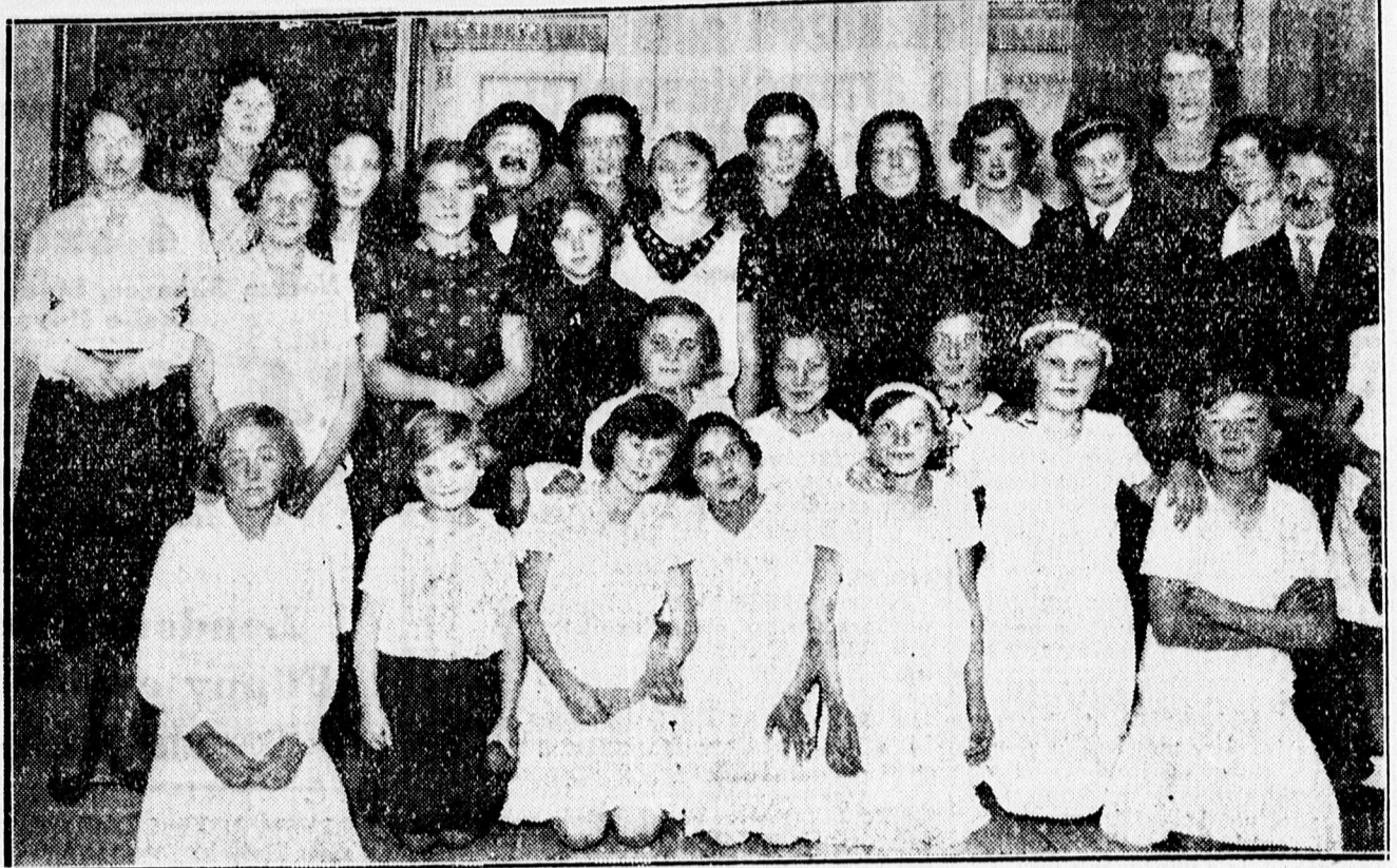
A csapókerti leánykörtagok előadás szereplői.