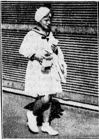
A legkisebb perselyező.

Miután az 1, 2 és 10 filléres pénzmekeknek olyan hatalmas tömege gyűlt össze, amelynek pontos összeszámolása napokat vesz igénybe, ezért az urnánkénti pontos elszámolást csak pár nap múlva közölhetjük.