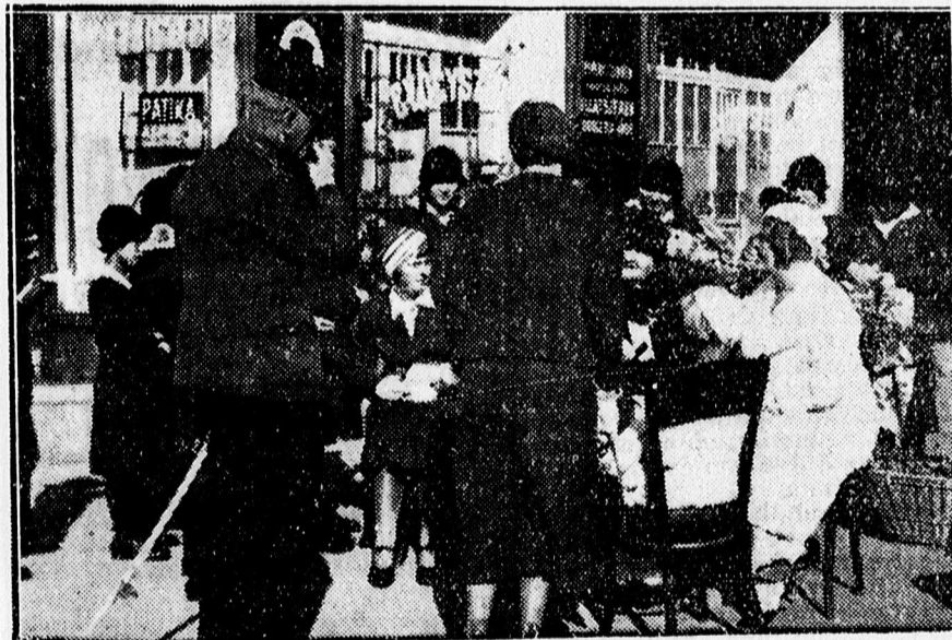
A Patronage egyesület gyűjtőnapján a Gambrinus előtti urnánál.