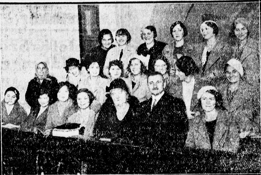
A KUYPER KATALIN LEÁNYKÖR ÖSSZEJÖVETELE A REF. KOLLÉGIUMBAN.