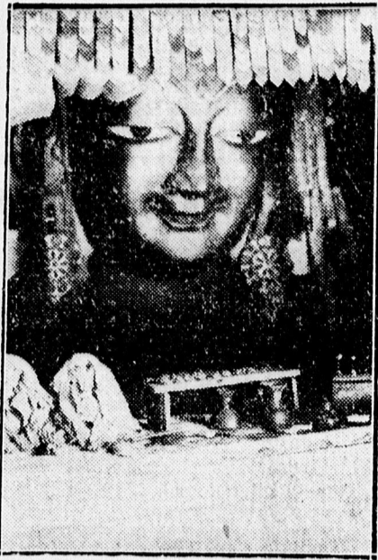
Óriási Budhahfej a lehi kolostorban.