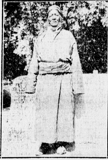
Gazdag lehi kalmár.