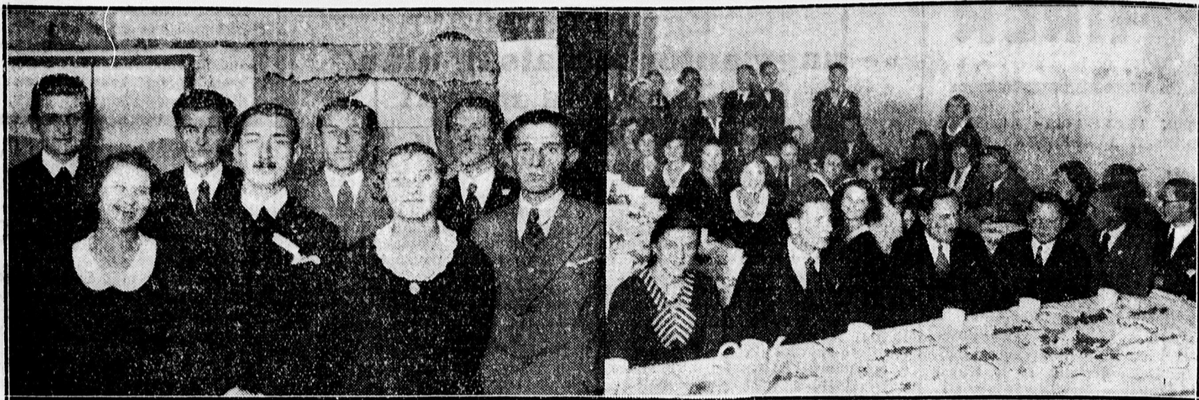
A kerekestelepi KIE és leánykör szeretetvendégségének szereplői.