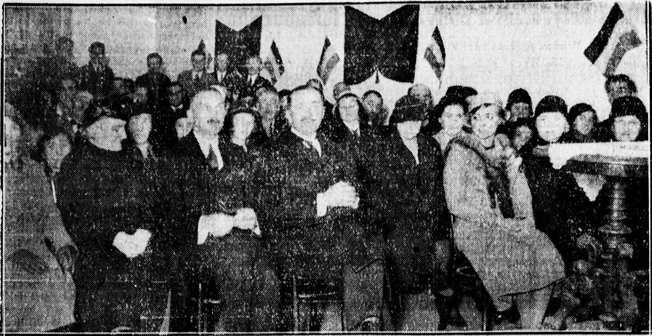
A KIE JUBILEUMI ÜNNEPÉLYERŐL.