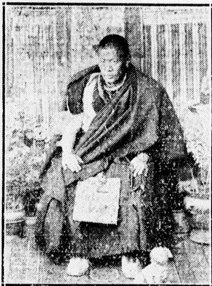
Tibeti láma kolostor főnöke.

Baktay Ervin vasárnap délelőtti előadása a legnagyobb sikerre szá-