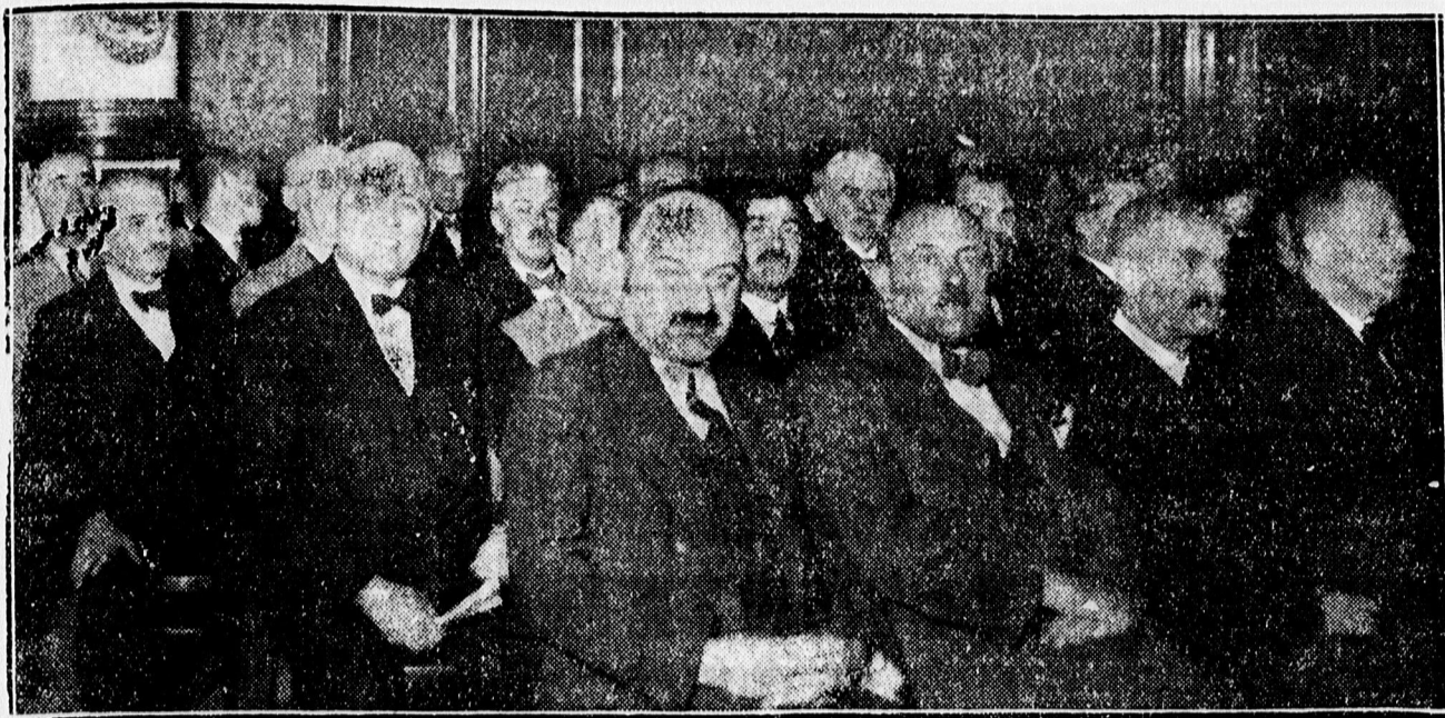
A REF. TANITÓK KÖZGYÜLÉSÉRŐL