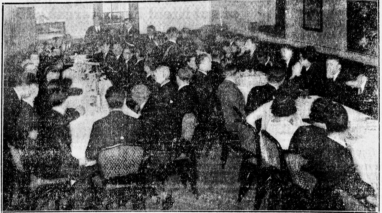
A SZEFFE AVATÓ TABOROZÁSA AZ »ANGOL KIRÁLYNÓ«-BEN.

— Megüresedett vassátor. Az Árpád tér 26. számú ház előtti közterületen épült 22 számú vassátor esztelen megüresedésére kilátás lévén: felhívom elsősorban a hadigondozott, (hadiárva, hadirokkant, hadiözvegy) vagy ilyen igénylők nem létében a jelzett vassátorát bérbevenni kívánó debreceni illetőségű igénylőket, hogy a vassátoros érteleme iránti igényeiket az elsőfokú közigazgatási hatóságnál (Kessuth u. 20. földszint 28. sz. szoba) f. évi október hó 28. napjáig írásban jelentsék be. Az igénylő 36 pengőt kész pénzben vagy óvadékképes értékpapír alakjában (takarékhelyi könyvön) a város házipénztáránál az igény bejelentése előtt helyezzen letétbe és ennek megtörténtét a jelentkezéskor igazolja. A bérleti időtartam 3 év. A vassátorban árusítani lehet: 1. hírlapokat, sajtótermékeket, 2. csmegefeleket, 3. trafikműveket. Polgármester,