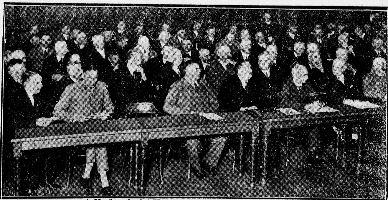
A Mezőgazdasági Kamara rendkívüli közgyűléséről.

Gáztűzhely Dítmar-féle Démon petroleum bárhoz gázvezeték nélkül. folytonégőkályha. Hely képviselő: Elektromosság, Csillár, Rádió szaküzlet. Kényelmes fizetés. Költségvetés bemutatás. Ferenc József-ut 83.