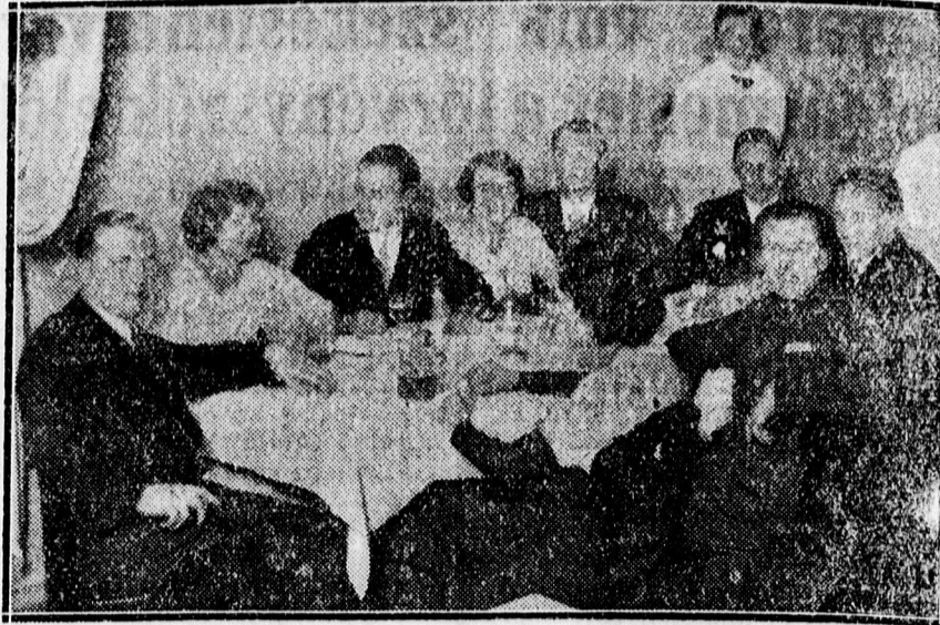
A Bikában rendezett MANSz teadélutánról.