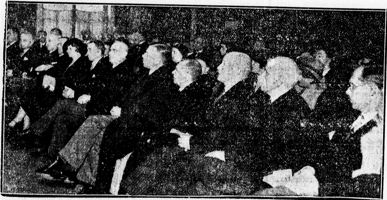
Az Iparoskör jubileumi diszközgy ülése.

IDÓPROGNÓZIS: Északnyugati légáramlással változóan felhős idő, kisebb záporok. Reggelre a felhőzet esőkkenésére és kisebb esőkre van kilátás.