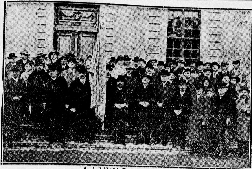
A jubiláló Iparoskör tagjai.