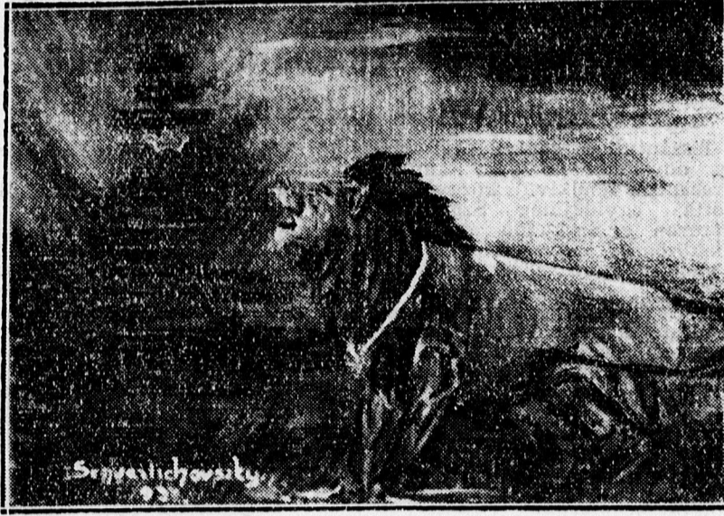
Magyar ifjak feltámadása c. kép.