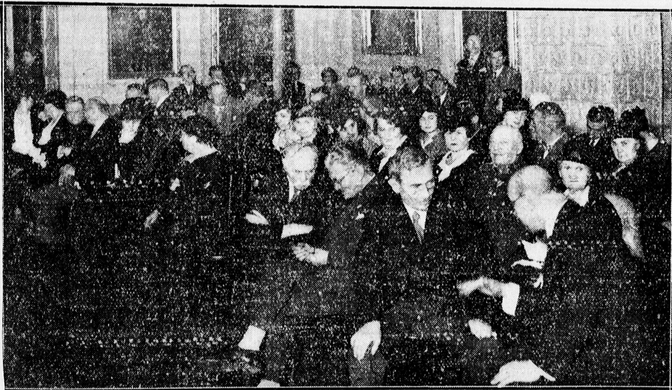
A Csokonai-Kör előadásának közönsége.