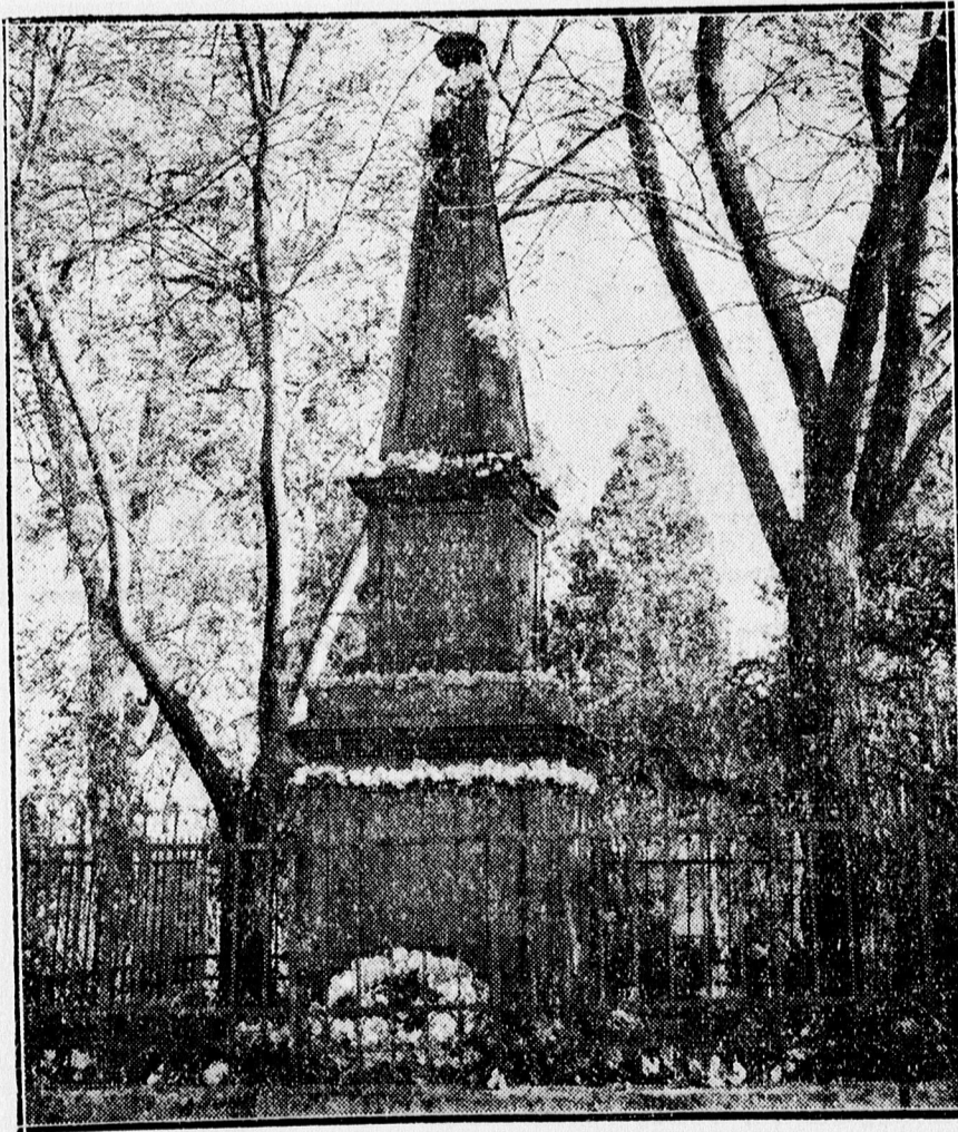
Szokoni virággal díszített sírja a Hatvan ucai temetőben születésének 160. évfordulóján.