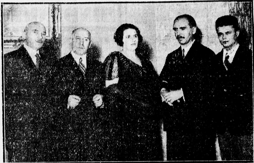
A Csokonai-Kör előadásának szereplői.