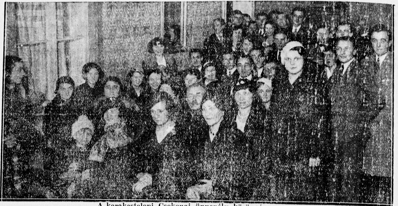
A kerekestelepi Csongrád-i ünnepély közönsége.