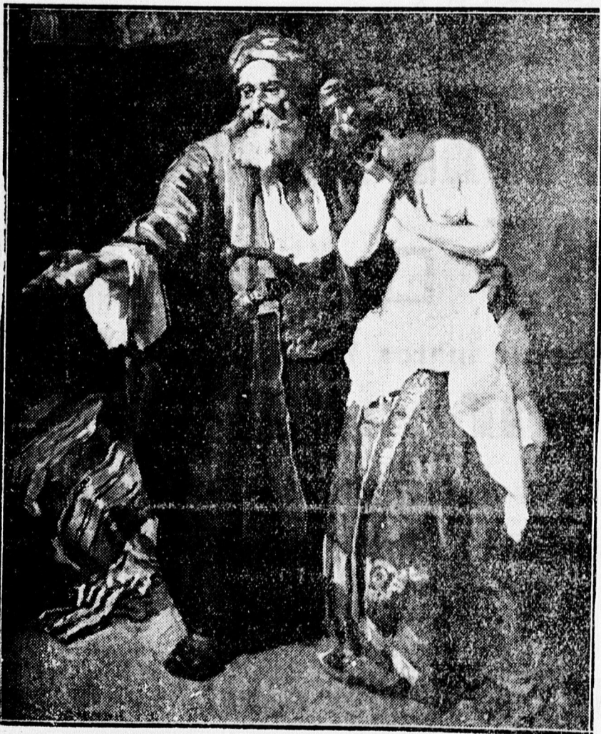
Mihalovics Miklós: RABSZOLGAVASÁB