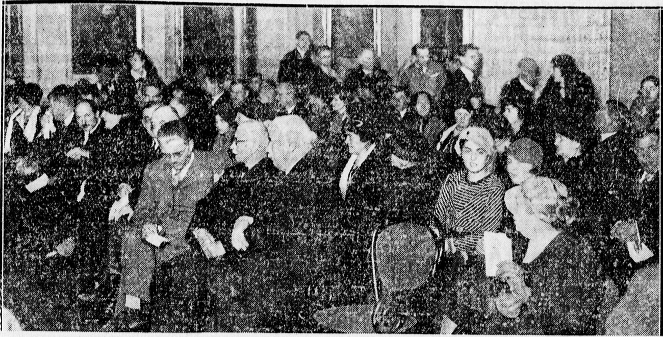
A SOLI DEO GLORIA ELŐADÁSÁNAK KÖZÖNSÉGE

cipőüzlet, Ferenc József ut 49. Telefon 26-16.