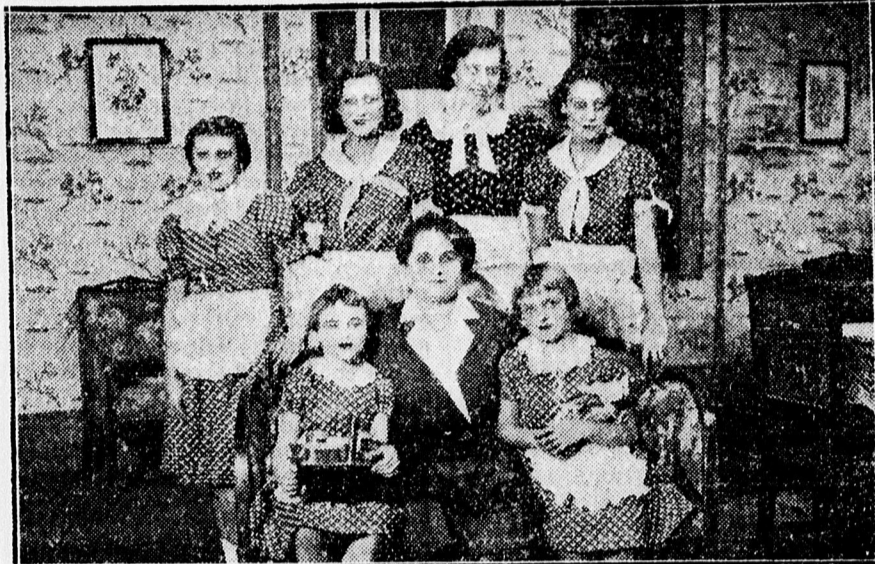
A Jótékony Nőegylet előadása - Csokonai színházban. — „Gyurkovics leányok”.

Ujévi tejmalacokat napiáron vásárol Bőd húsüzem Csapó 8. Kossuth u. 57