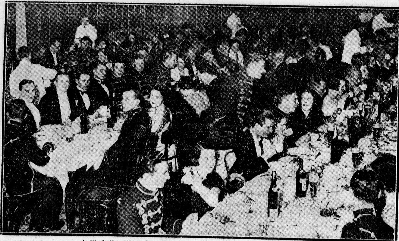
A tüzértisztikar Borbála-napi estélye az Arany Bikában.