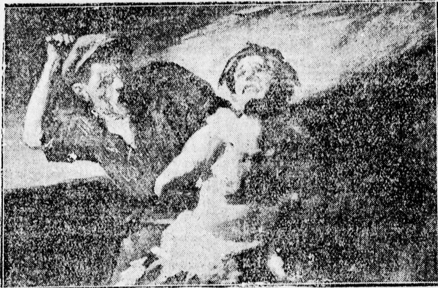
Kukán Géza: „ZENBÜLÖK”

A kiállítás megtekinthető díjtalanul délelőtt 10—1-ig, délután 3—7-ig.