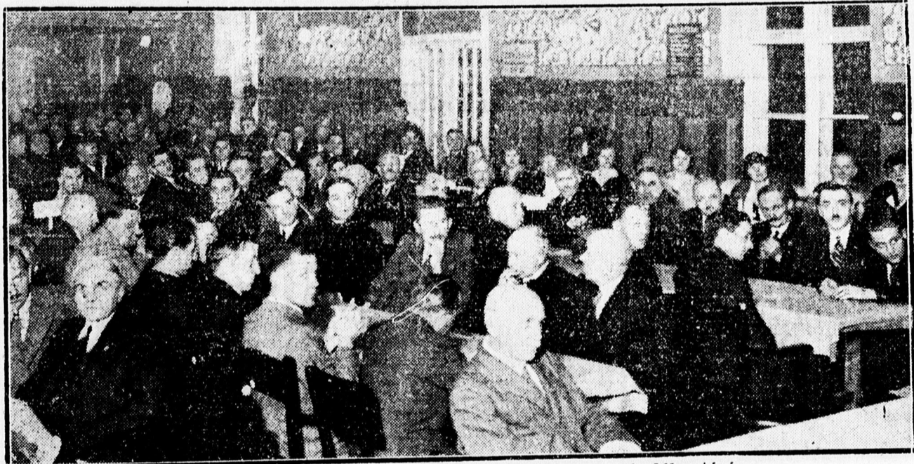
Nagyszámú közönség a Nemzeti Egység máv. műhelytelepi zászlóbontásán.