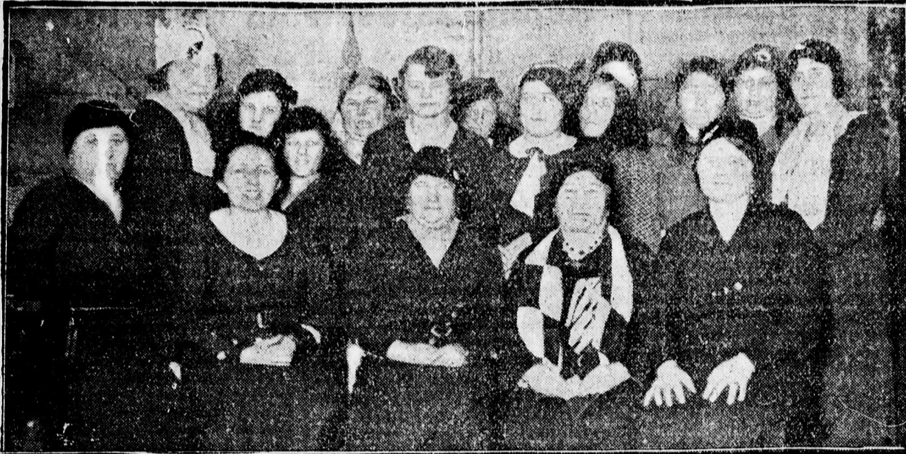
Szép ünnepséget rendezett a homokkerti egyházzsolt vasárnap az első homokkerti ref. istentisztelet harminc éves évfordulója alkalmából. A Tabitha nőegylet szeretetvendégsége zárta be az ünnepélyt. — Képünkön a nőegylet tagjai.