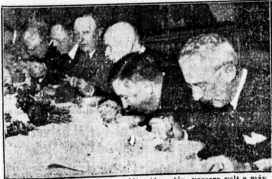
A Nemzeti Egység 6. körzeti zászlóbontása után, vacsora volt a máv. műhelytelepen, melyen a gulyást mindenki kis bográcsban kapta és az izletes gulyást a megjelent előkelő vendégek is jóízűen fogyasztották el.