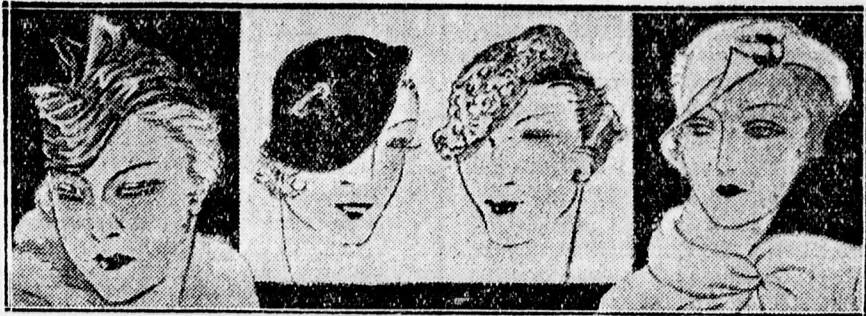
Selyembársony 4-6 P. Angora baret Selyem 5-6 P.