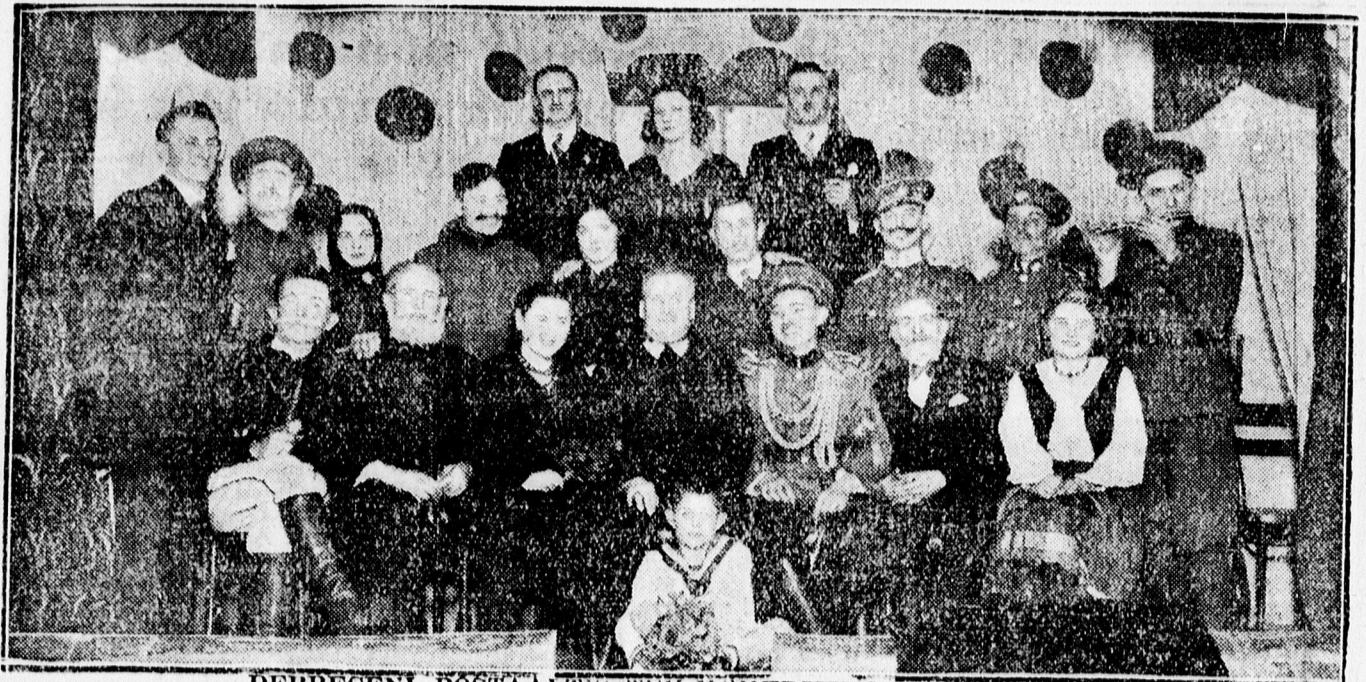
DEBRECENI POSTAALISTÉK MŰKEDVELO CSOPORTJA.