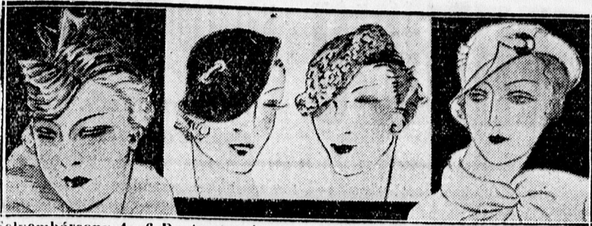
Selyembársony 4-6 P. Angora baretu 3 P. Selyem 5-6 P. Selyem perzsa 5-6 P. Füle 4-5 P. Nyulszőr 5-6 P.

Annny üzeni: BABY-FAZON A LEGUJABB DIVAT! Csapó u. 1. (Szemben a Nagytemplommal.)