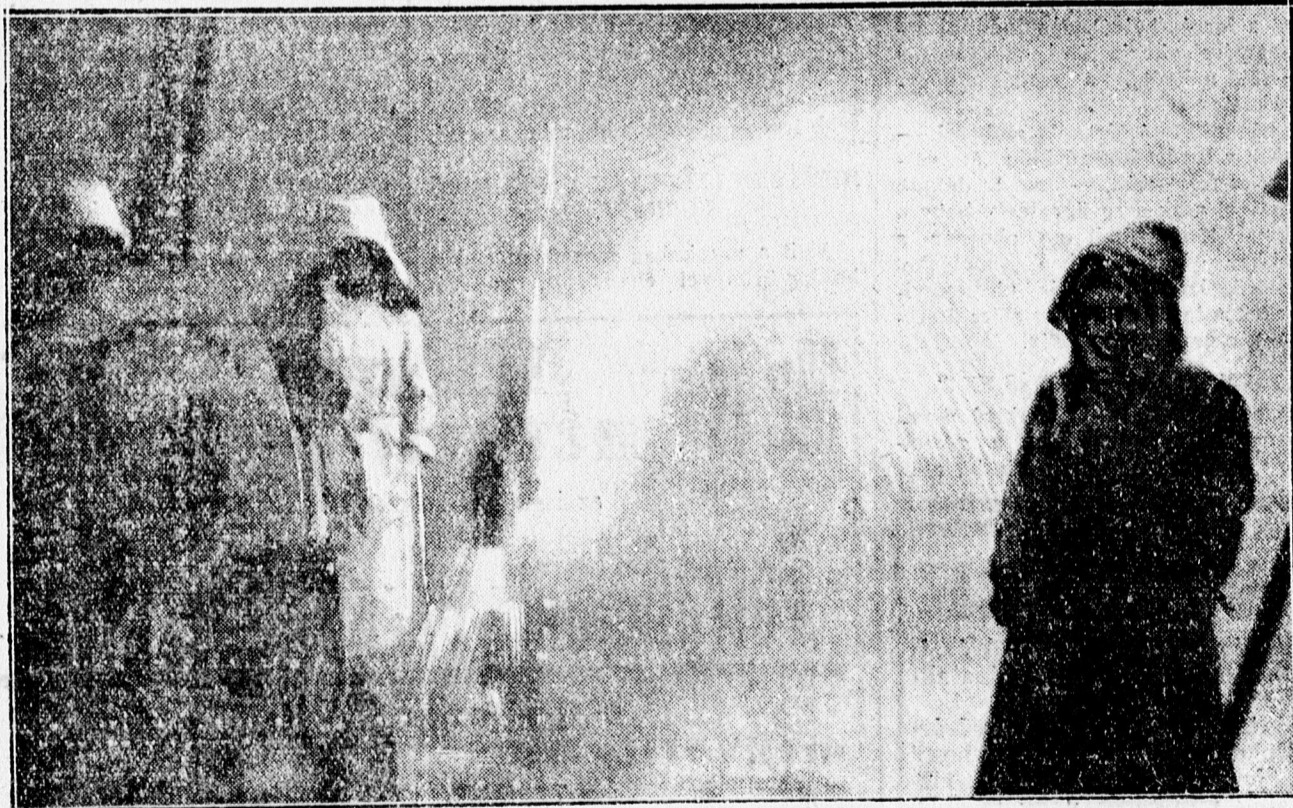
A MÁSODIK HŐFORRÁS FELTÖRESE.

A víz eleinte igen iszapos és homokos volt, de a hőfok emelkedésével a víz is tisztult bizonyos mértékig.