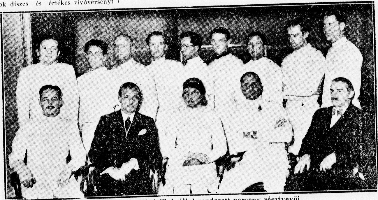
A Békessy Béla Vivó Club által rendezett verseny résztvevői.