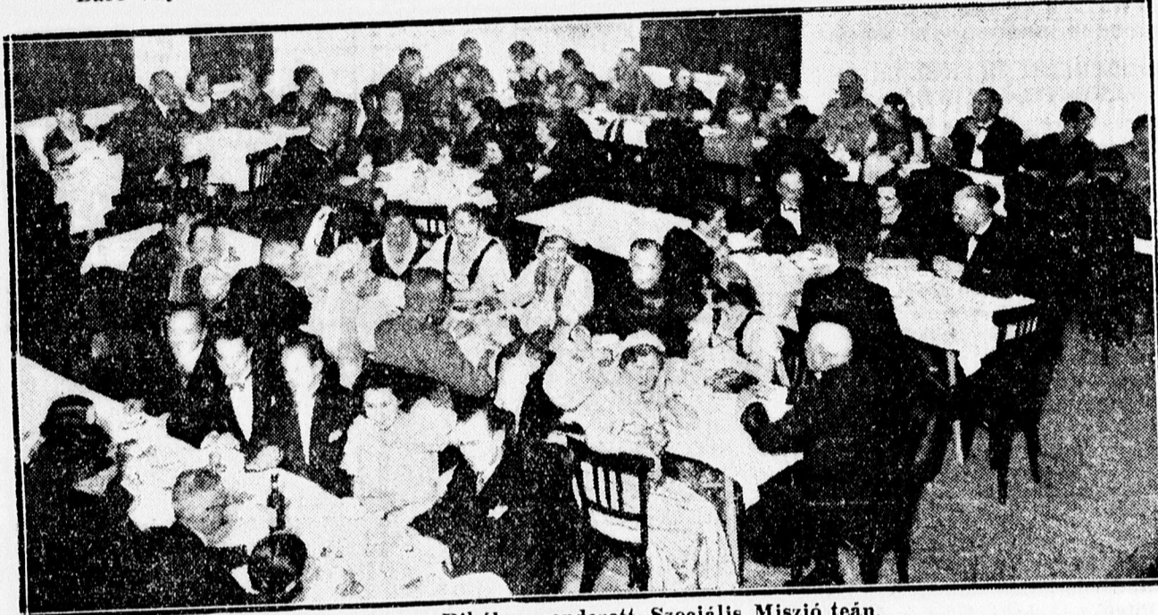
Közönség az Arany Bikában rendezett Szociális Misszió teán.