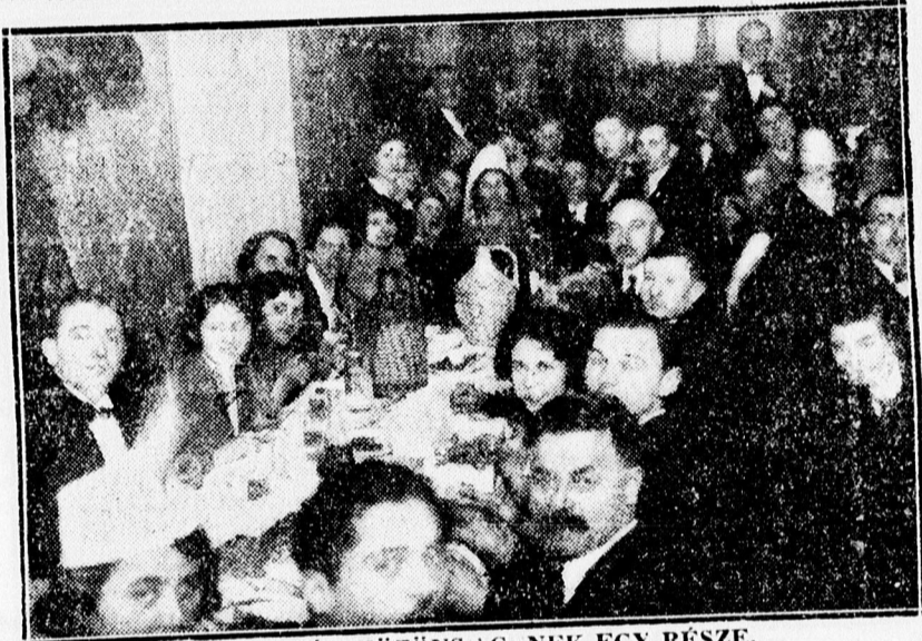
A CSIZMADIA-BÁL KÖZÖNSÉGE NEK EGY RÉSZÉ.