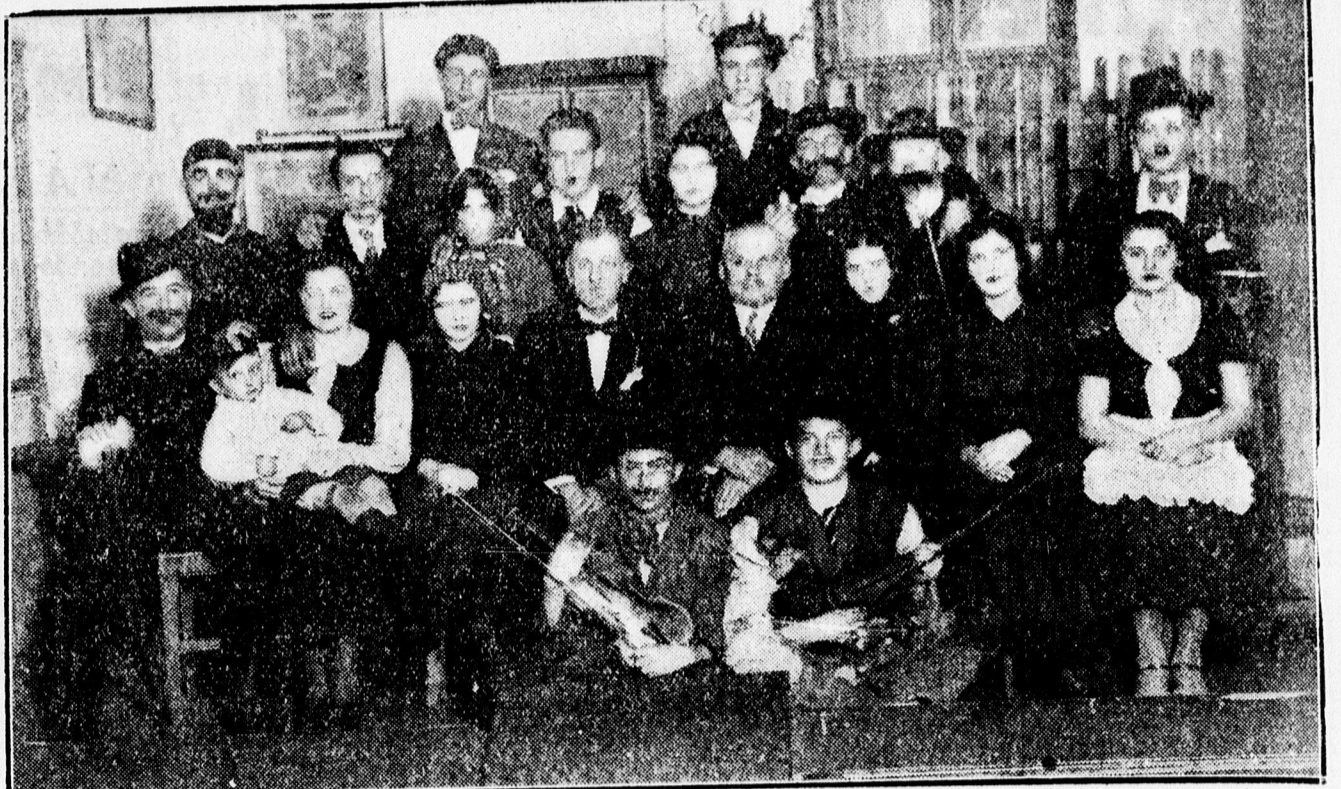
A HOMOKKERTI OLVASÓKÖR MŰSOROS TÁNCSTÉLYÉNEK SZEREPLŐI.

Analfabéta tanfolyam. Az Iskolán kívüli Népművelési Bizottság, azok részére, akik írni-olvasni nem tudnak — Miklós uca 23. szám alatt, az állami kiegészítő iskola helyiségében, teljesen ingyenes tanfolyamokat létesít. Ezúton is felkéri a bizottság a gyárak, üzemek vezetőségét, valamint városunk nagyközönségét, hogy írni-olvasni nem tudó ismerőseit, vagy alkalmazottjait a tanfolyamokra való jelentkezésre buzdítsák. Jelentkezni lehet 9—1 óra között a bizottság titkári hivatalában. (Miklós uca 23. szám).