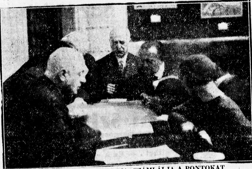
A ZSŰRI EGYIK CSOPORTJA SZÁMLÁLJA A PONTOKAT.

A rendőrség megindította a vizsgálatot és kutatták, hogy kit terhel a felelősség a kisgyermek sérülései miatt. A vizsgálat során megállapítást nyert, hogy a gyermek anyjának még 1927. évben levágta a vonat a két lábát. — A béna asszony tehetetlenül volt kénytelen nézni gyermeké szenvedését és nem siethetett segítségére. Gondatlanság az anyát így nem terheli.