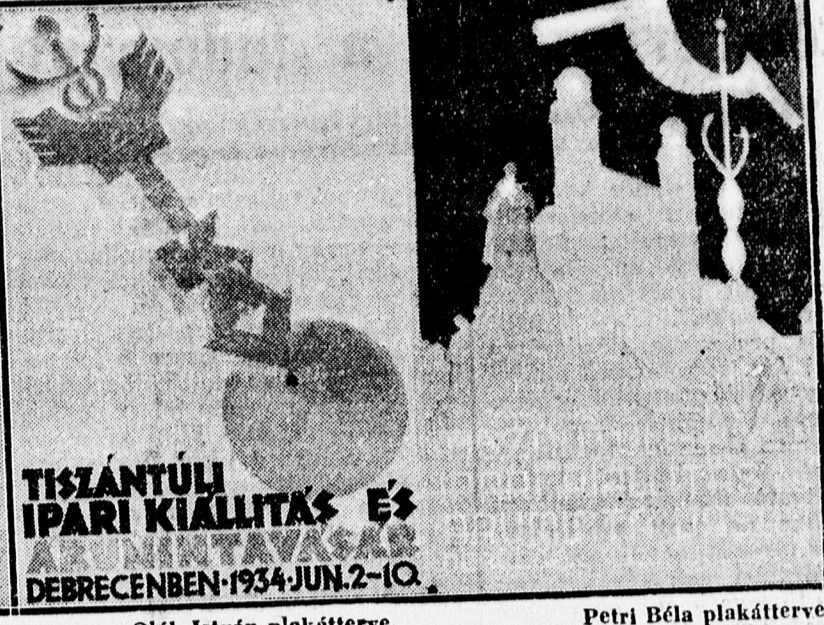
Oláh István plakátterve.