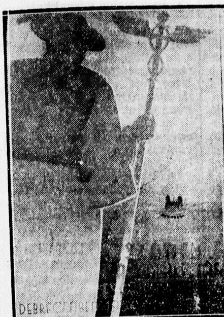
Petri Béla plakátterve.