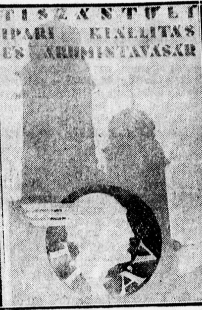
D. Szabó díjnyertes plakátja.