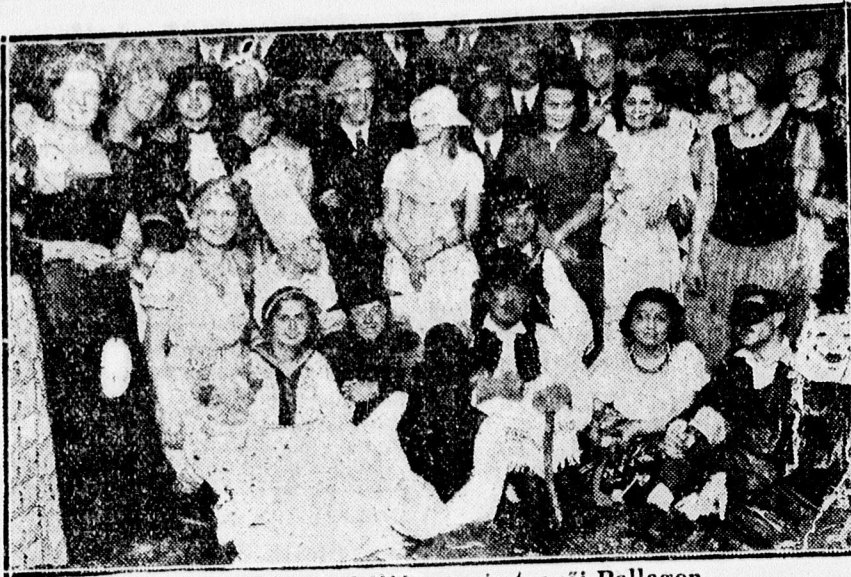
Gazdászok álarcos haljára résztvevői Pallagon.