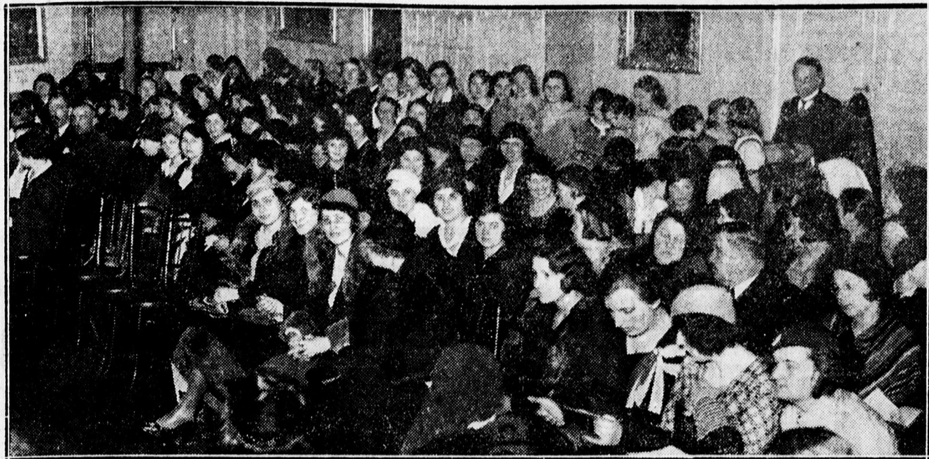
A LEÁNYKÖRÖK ELŐADÁSA A KOLLÉGIUMBAN.