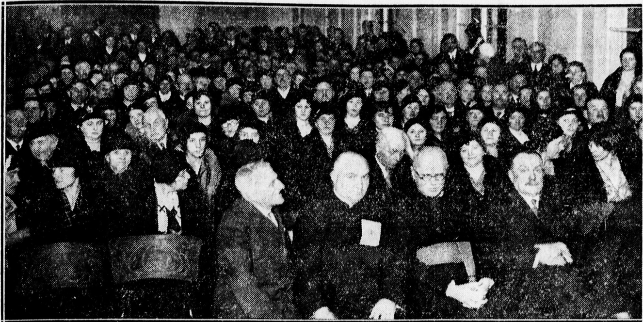
Kulturdélután a kat. gimnáziumban