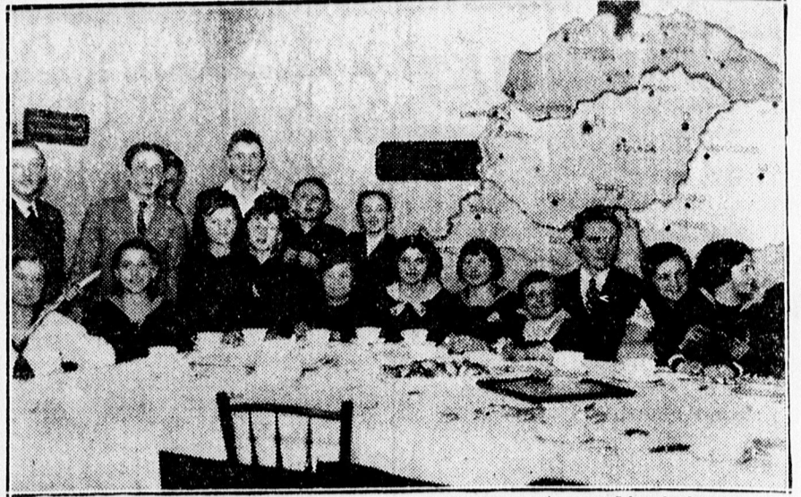
A gyerekek asztala a lutheránus egyház szeretetvendégségén.