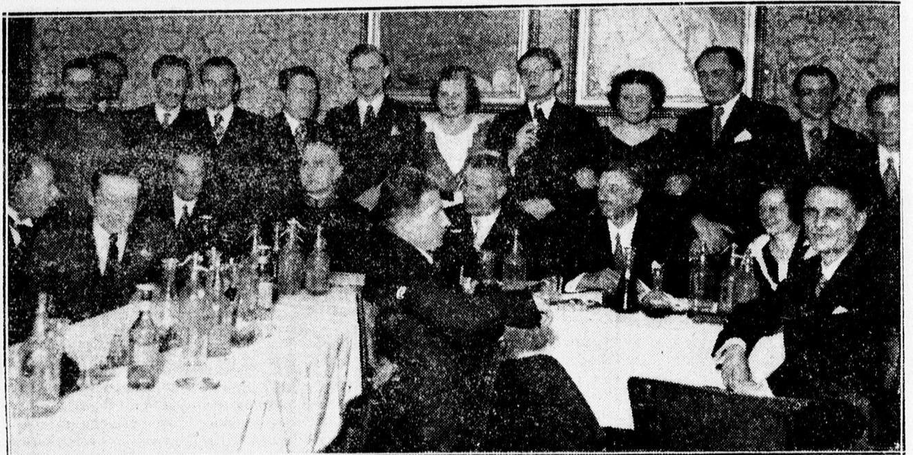
A DEAC atlétagárdájának összejöveteléről.

— Fux Antal vetítettképes előadása Gölnichányáról. Csütörtökön, március hó elsején, délután hat órakor a városháza közgyűlési termében Fux Antal, felsőkereskedelmi iskolai tanár tart igen élvezetes és vonzó előadást Gölnichányáról szép vetített képekkel kísérvé. Az Egyetemi Népszerű Főiskolai tanfolyam előadása iránt, — amely pontosan hat órakor kezdődik a városháza közgyűlési termében igen nagy az érdeklődés a társadalom minden rétegében. Az előadás ingyenes.