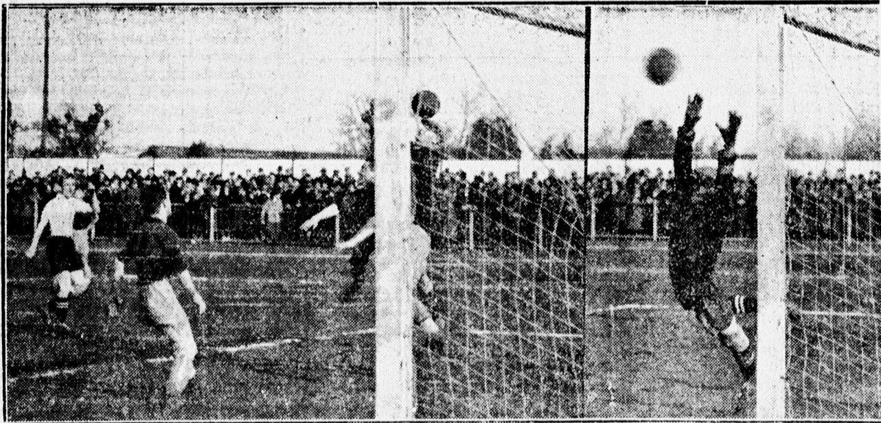
Markos lövi az első „dugót” a „Budai 11.” hálójába.