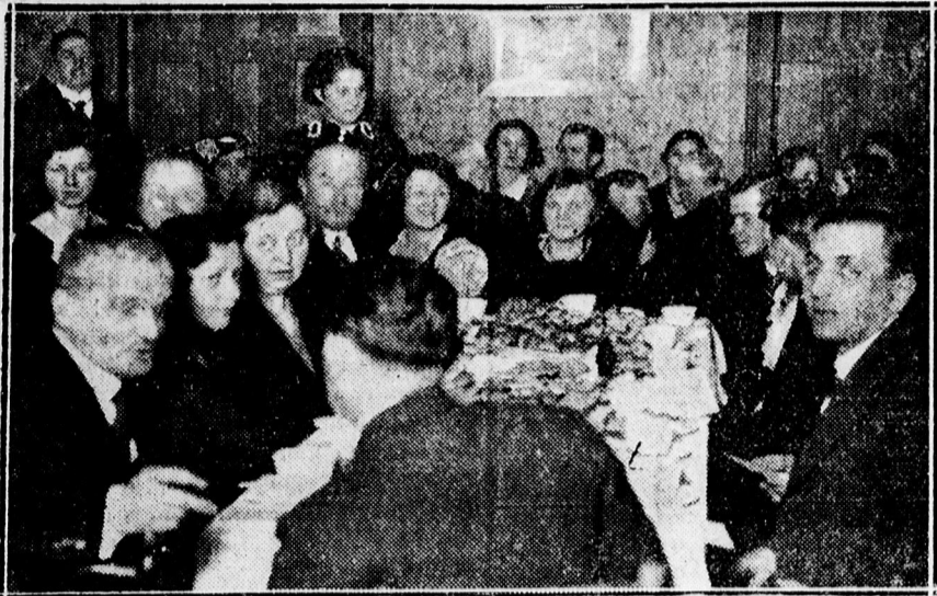
A lutheránus egyház műsoros szeretetvendégségéről.