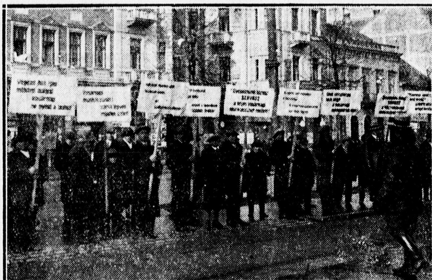
Fűszerkereskedők plakátpropagandája a vasárnapi munkaszünet érdekében.