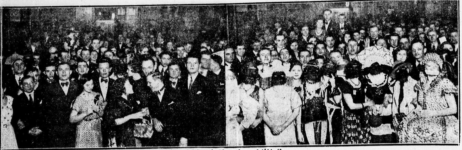
A Textilgyári Sport Club álarcsbáljáról.