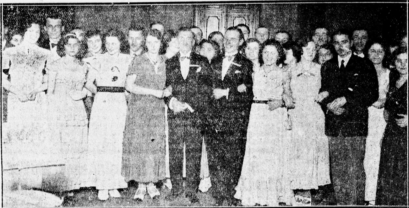
A kereskedőifjak táncestélyéről.