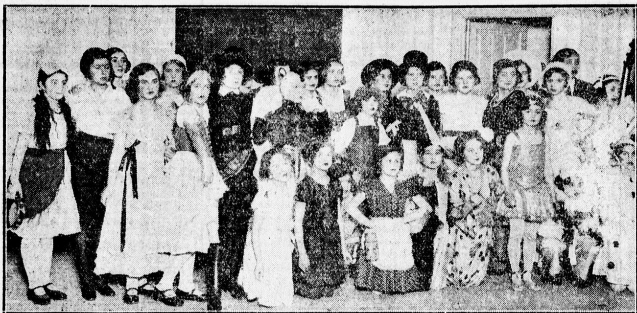
Az Arany Bikában rendezett purimi estén előadott „Karnevál a babüzletben” szereplői.