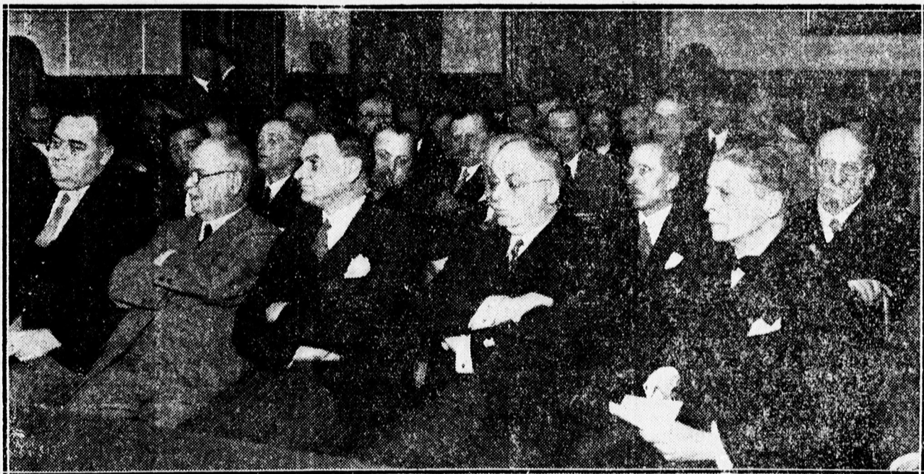
A KÖLCSONÖS SEGÉLYZŐ EGYLET JUBILÁRIS KÖZGYŰLÉSÉNEK KÖZÖNSÉGE.