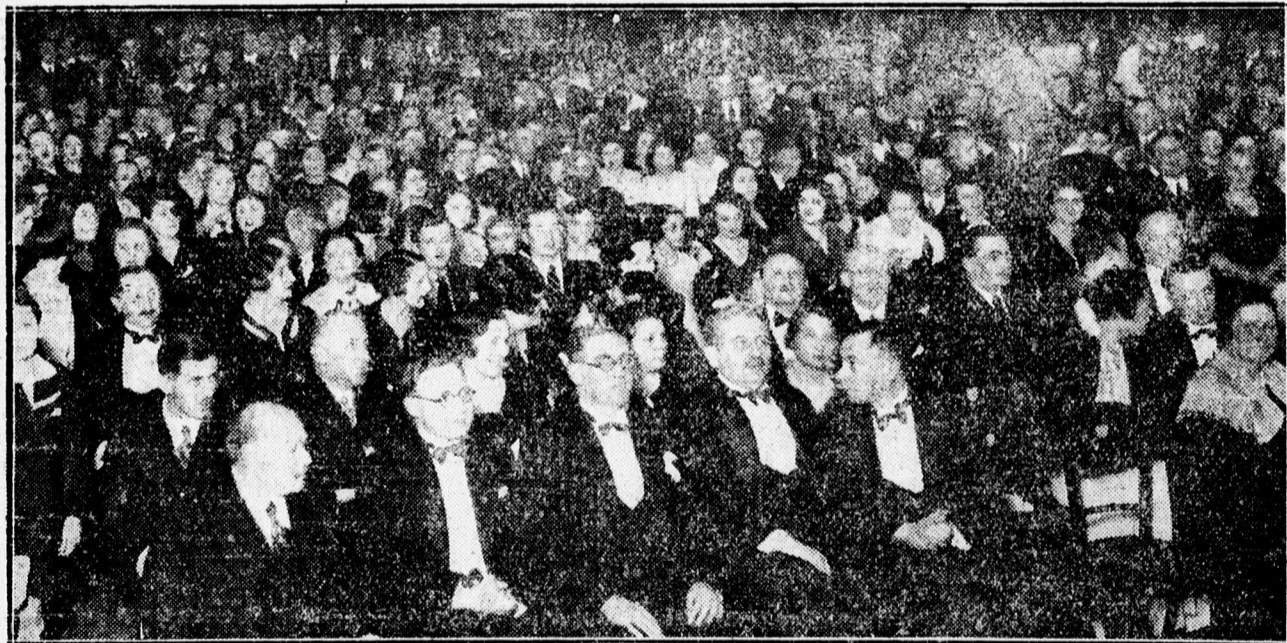
Óriási közönség az Arany Bikában rendezett purimi estén.