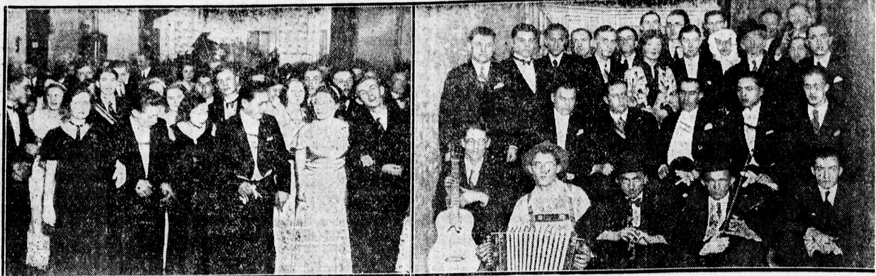
A „Szabad hajduk” bajtársi egyesület műsoros táncestélye Hajduböszörményben. A rendezőség és szereplők.