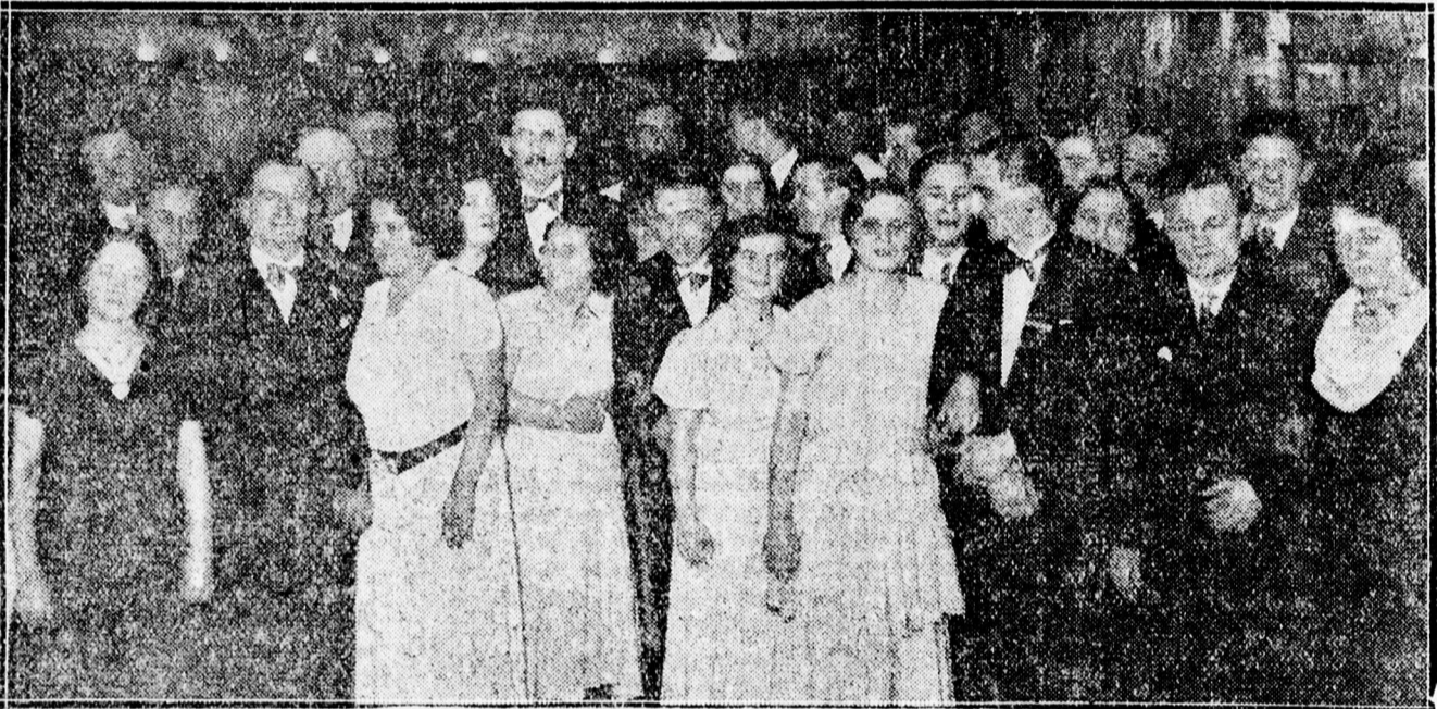
TÁNCOLÓ KÖZÖNSÉG A VENDEGLŐSBÁL ON.