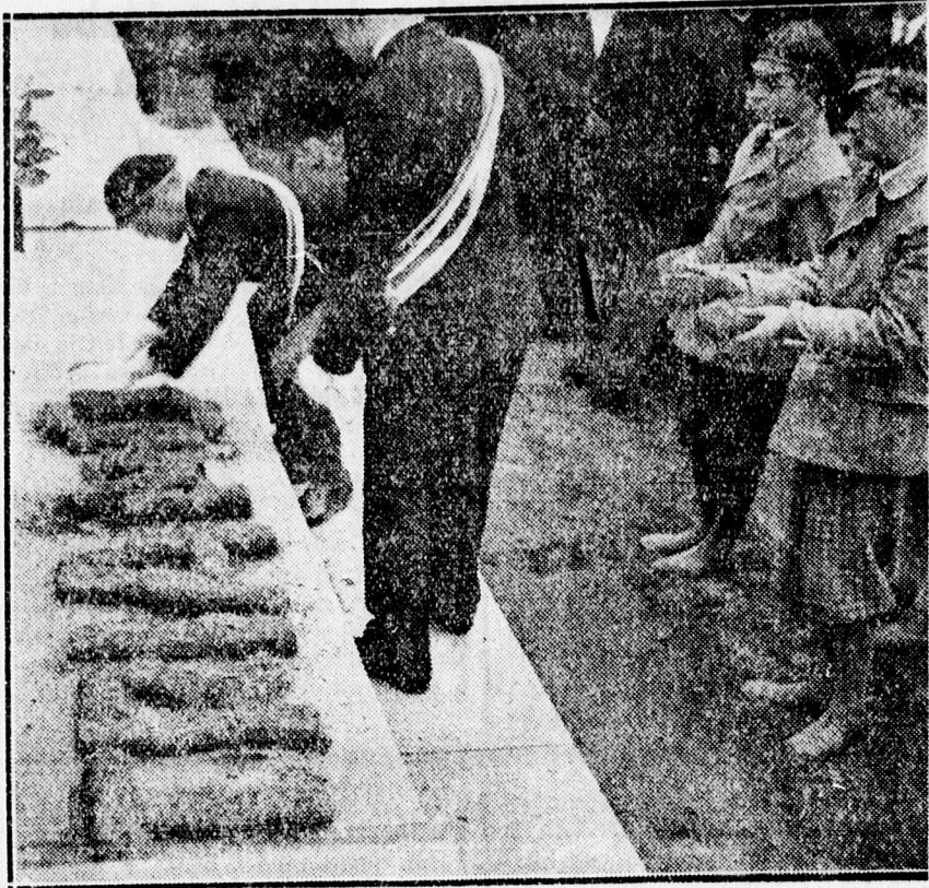
Debreceni egyetemi ifjak március 15-én a nyírábrányi határról gyepéglát hoztak, melyekből a Kossuth-szobor talapzatán kirakták ezt a szót Trianon.