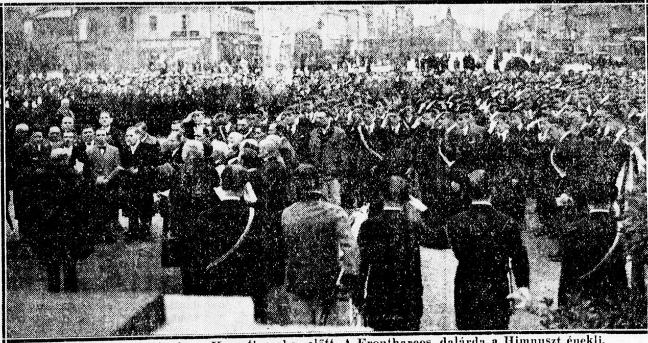
Az egyetemi ifjuság a Kossuth szobor előtt. A Frontharcos dalárda a Himnuszt énekli.