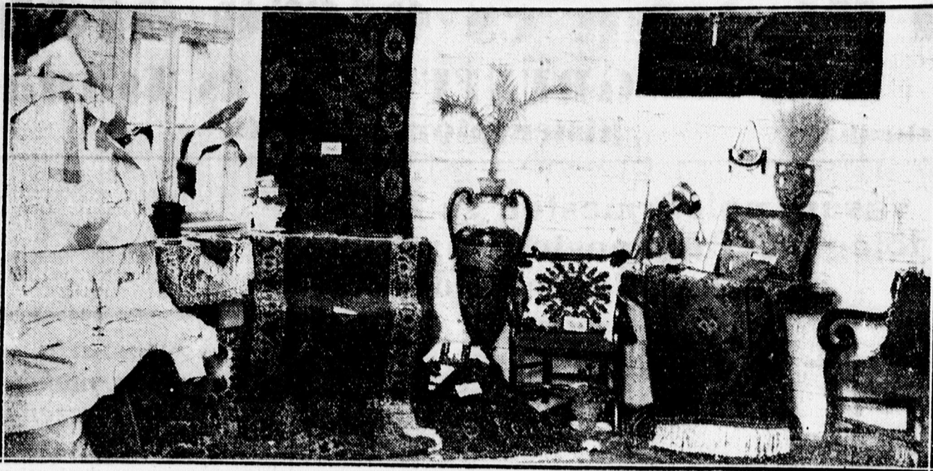
Részlet a Mansz szövetség kiállításáról.