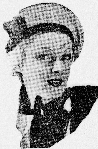
A barett örök divat, csak az anyaga és a viselés módja változik! Most ez a legújabb vonal. Különböző szalmafonatokból 2 pengő 50 fillér ANNY-nál (Csapó u. 1.)

A kettős öngyilkossági kísérlet ügyében a csendőrség nyomozást indított. Megállapították, hogy előbb a fiú vágta fel beretvával karján az ereket, majd a leány. A fiatalok állapota súlyos, de az orvosok bíznak felgyógyulásukban. Csak kevés vérvesztéséget szenvedtek, mert az öngyilkosságot hétfőn a kora reggeli órákban követték el és hét órakor már felfedezték tettüket.