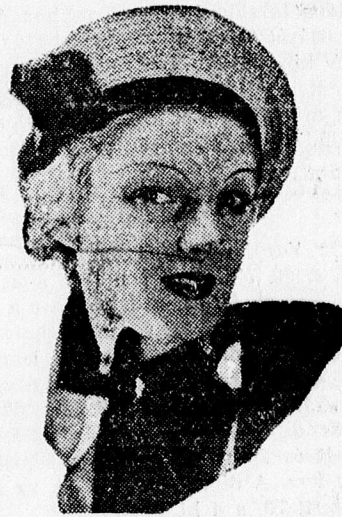
A barett örök divat, csak az anyaga és a viselés módja változik! Most ez a legújabb vonal. Különböző szalmafonatokból 2 pengő 50 fillér ANNY-nál (Csapó u. 1.)