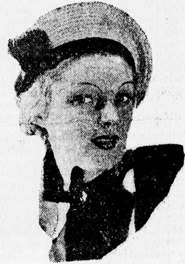
A baret örök divat, csak az anyagi és a viselés módja változik! Most ez a legújabb vonal. Különböző szalmafonatokból 2 pengő 50 fillér ANNY-nál (Csapó u. 1.)