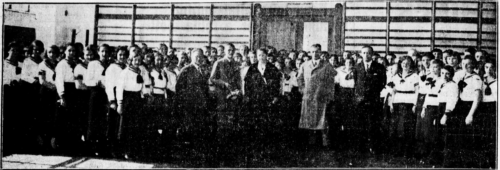
Kodály Zoltán a Dóczisták között.